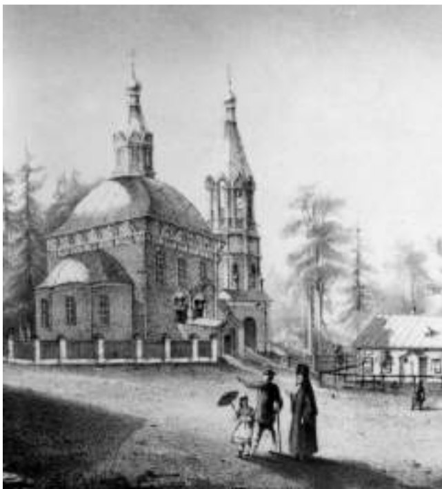
Боголюбская церковь. Фрагмент Литографии 1865 г.