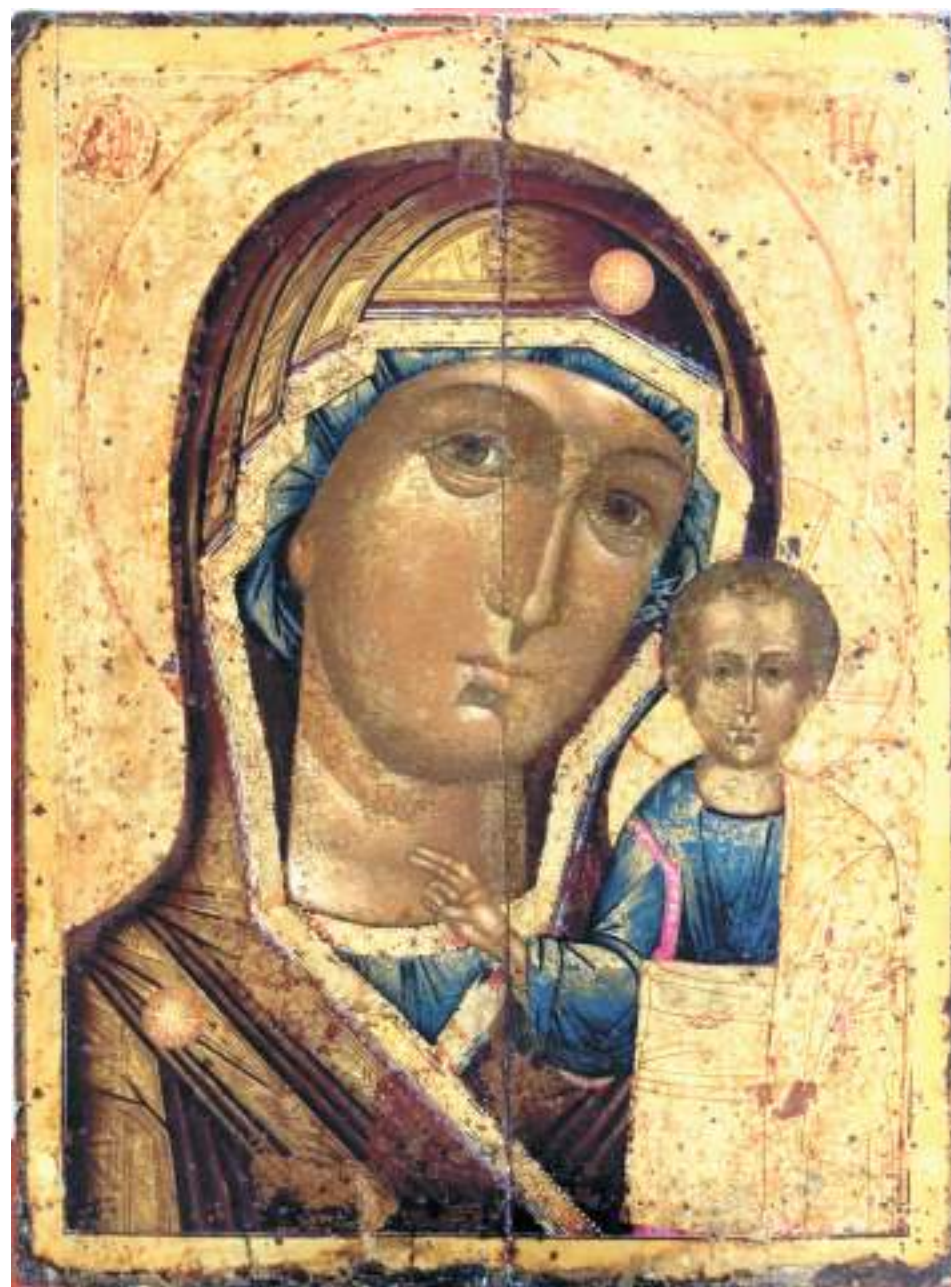
Икона Свято-Троицкого собора — один из древних списков с чудотворного первообраза. Этот образ был написан в XVIII веке. Впоследствии икону неоднократно переписывали. Первоначальный образ скрывали несколько слоёв поздней записи. В 2005 году икона была отреставрирована.