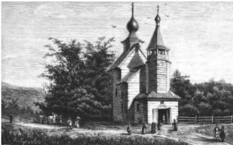
Сергиевская церковь, рисунок из журнала «Нива», 1850 г.