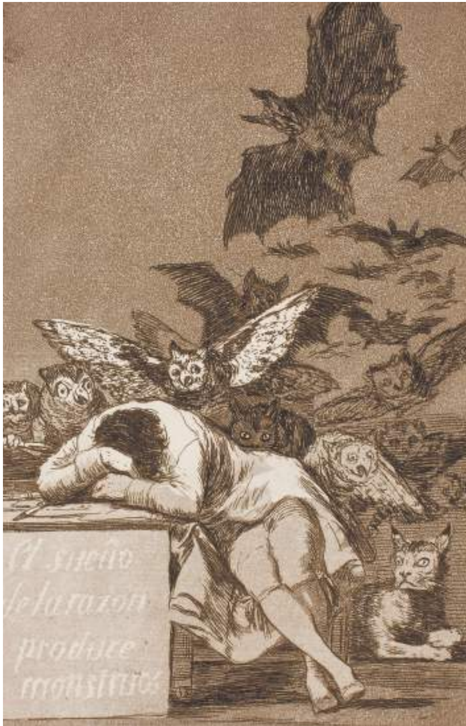
Сон разума рождает чудовищ. Франсиско Гойя. 1797 год

Если говорить о свободе познания, то здесь нужно просто остановиться перед непреодолимой бездной, открывающейся на пути человека. О ней всегда говорили философия и религия, но теперь об этом во весь голос сказала и наука. Можно бы привести множество высказываний учёных по этому вопросу. В качестве примера сошлюсь на крупнейшего американского физика Ричарда Фейнмана, который в одной из своих лекций доказывал студентам, «почему наука недостоверна», и заканчивал выводом: