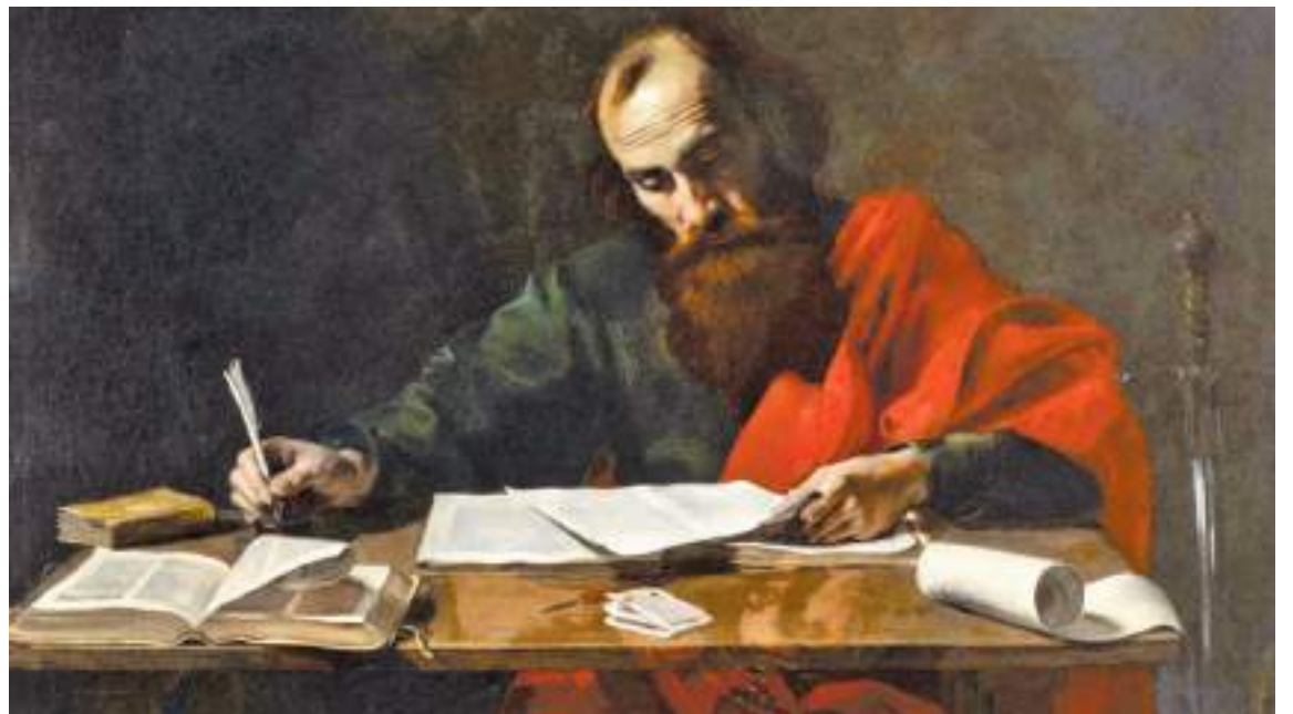
Валантен де Булонь. Апостол Павел пишет свои послания

Славяне начали почитать день Петра и Павла сразу после Крещения Руси. Как говорит церковное Предание, первую икону святых апостолов на русскую землю привез святой