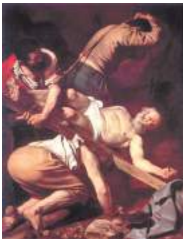
Караваджо. Распятие святого Петра. 1601 г.

В конце Петрова поста — 12 июля, в день святых первоверховных апостолов Петра и Павла — мы будем вспоминать