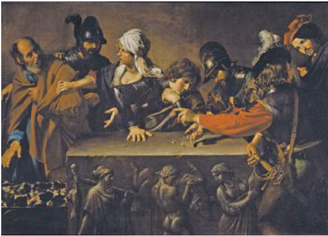
Валантен де Булонь. Отречение святого Петра