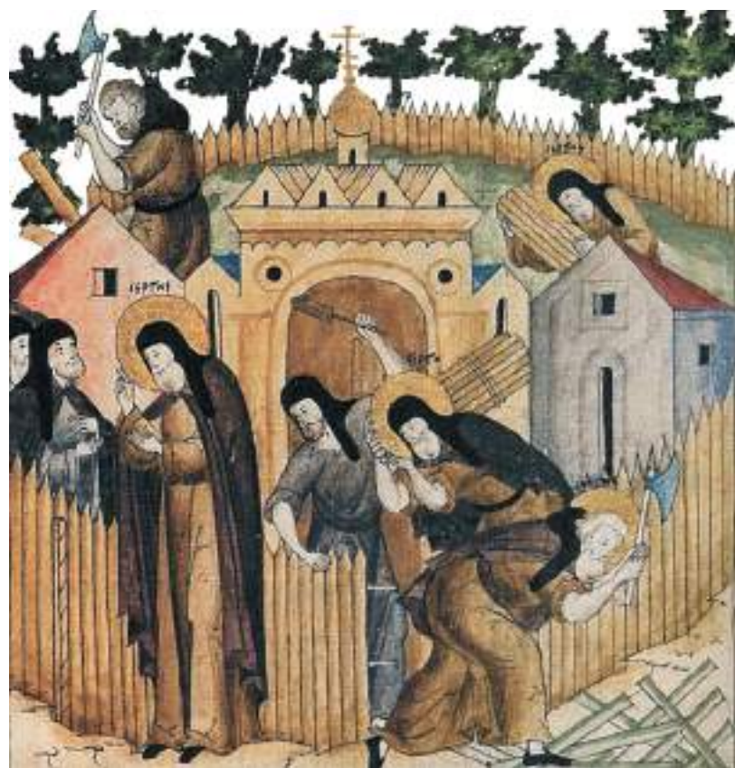
Преподобный участвует в строительстве келий основанной им обители. Миниатюра из «Жития Сергия Радонежского» (XVII в., РГБ)