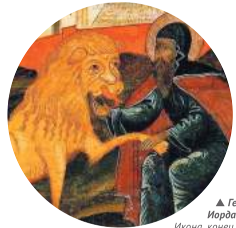
▲ Герасим Иорданский. Икона, конец XVII в.

Почему изображения животных на иконах такие необычные?