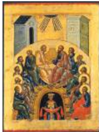
◀ Сошествие Святого Духа. Икона, XV в.

Так же и на иконах Вознесения Господня и Сошествия Святого Духа: число фигур — двенадцать — неизменно, а состав меняется. Обычно в этих сценах апостолов не подписывали, и о том, кто есть кто, мы догадываемся по характерным портретным чертам. Рядом с ангелами, которые указывают на возносящегося Христа, стоит человек с высоким лбом и острой темной бородой — это, по всей видимости, апостол Павел. Его черты мы часто встречаем и в «Сошествии Святого Духа», хотя исторически Савл в это время был гонителем христиан, а в число двенадцати апостолов избрали Матфия. Но образы рассказывают о рождении Апостольской Церкви, поэтому присутствие на иконах первоверховного апостола полнее раскрывает этот евангельский смысл. ☩.