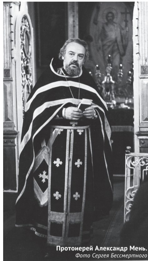
Протоиерей Александр Мень.