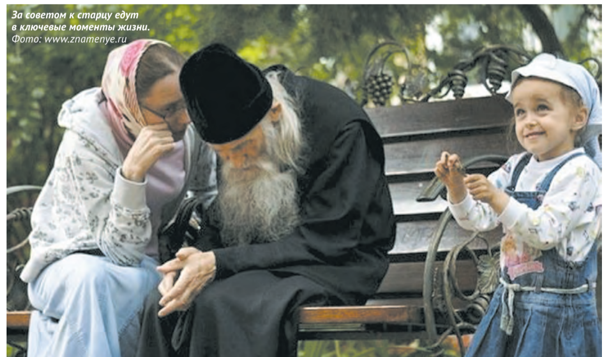
За советом к старцу едут в ключевые моменты жизни.

Мать наша в колхозе работала и ни копейки при Сталине не получала. Но в то же время не пересчитать, сколько надо было налогов платить: подоходный налог, самообложение, заём,