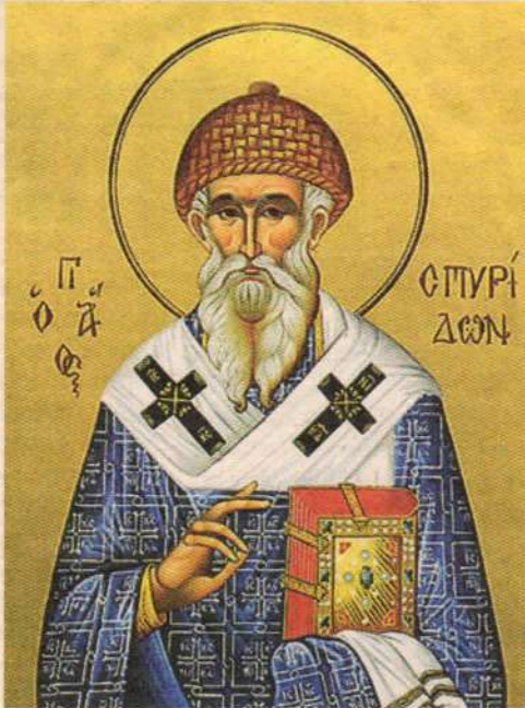
Икона святителя Спиридона Тримифунтского

друга, оклеветанного и приговоренного к смерти, святитель был остановлен в пути неожиданно разлившимся от наводнения ручьем. Святой приказал потоку: «Стань! Так повелевает тебе Владыка всего мира, дабы я мог перейти и спасен был муж, ради которого спешу». Воля святителя