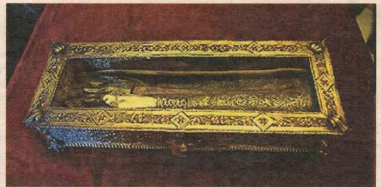
Десница святителя Спиридона Тримифунтского

Мощи его покоятся на острове Корфу (Греция) в церкви в честь его имени.