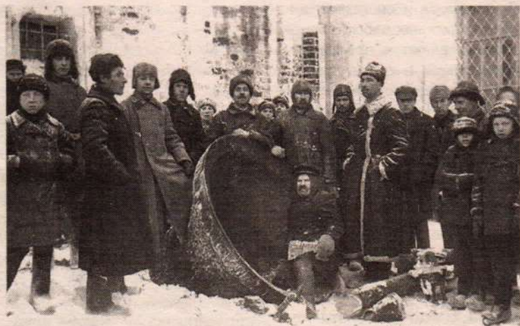
Это не должно повториться!

Уверены, что из нынешних испытаний, как и в XX веке, наша Церковь выйдет более сильной. Ни новые трудные времена, ни "немошные дерзости" не разделят и не ослабят нас, ибо мы преодолеем их с молитвой и с упованием на всесильную помощь Божию, зная, что всякое зло и всякая неправда уже побеждены силой Креста и Воскресения Христова.