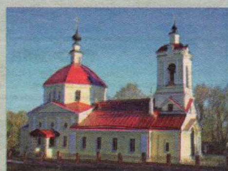
Иоанно-Богословский храм дер. Слотино, 2010г. Основание - 1822г., начало возрождения - 1992г.

Престольный праздник прихода Иоанно-Богословского храма деревни Слотино.