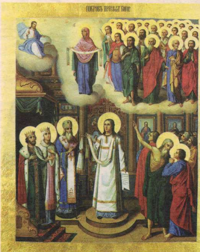
Икона "Покров Пресвятой Богородицы". Хотьковский женский Свято-Покровский ставропигиальный монастырь

Но не все воочию видят явление Ее. Только двое, чья жизнь отдана Богу, правде и истине, чье сердце у ног Спасителя, только они поражены видением. Это святой Андрей, Христа ради юродивый, славянин по происхождению, и ученик его Елифанний.