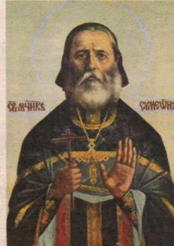
Священномученик Симеон Лилеев. 1873-1937гг.

Для дачи свидетельских показаний 15 сентября был вызван 32-летний секретарь Константиновского районного исполнительного комитета, который сказал: "Мне известно, что в 1936