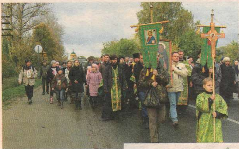
"Крест — хранитель всея Вселенной..."

(Светилен канона Воздвижению Креста Господня)