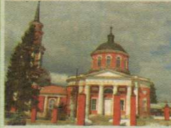
Ахтырский храм деревни Ахтырка

15, воскресенье. Неделя 6-я по Пятидесятнице. Положение честной ризы Пресвятой Богородицы во Влахерне. Ахтырской иконы Божией Матери.