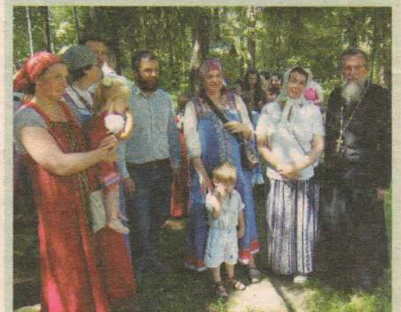
День семьи, любви и верности в музее-заповеднике "Абрамцево"

Продолжился праздник выступлением учащихся воскресной школы храма Ахтырской иконы Божией Матери. Учащиеся школы показали представление "Репка". После выступления на открытом воздухе были устроены чаепитие, интерактивные программы, народные игры, экскурсии.