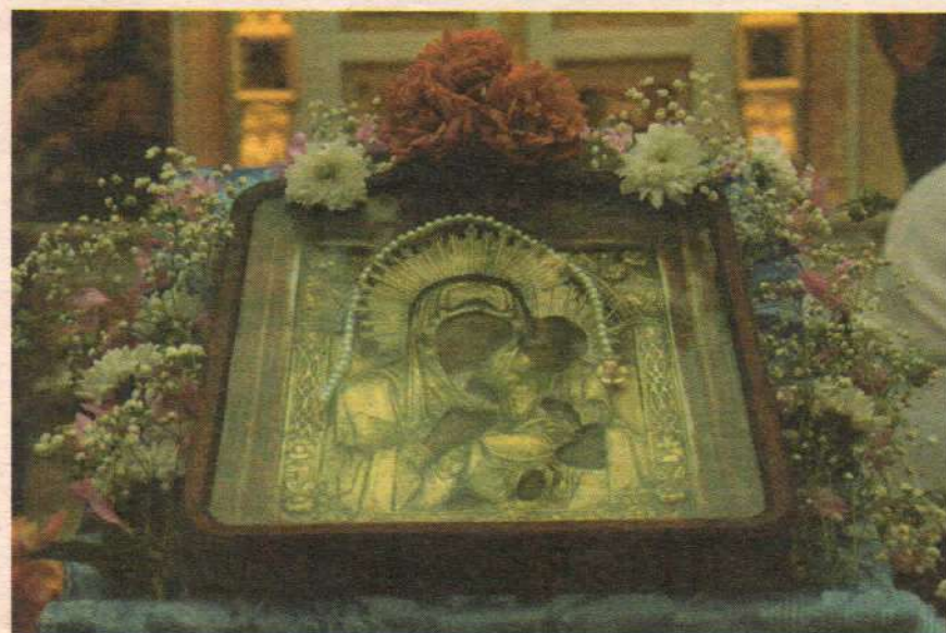
Храмовая икона Тихвинского храма села Выпуково

Человек, воспитанный в современных ценностях, ожидает внимания только к себе, думает только о себе и заботится тоже только о себе. Он — "центр мироздания", вокруг которого все должно вертеться, и без которого, как ему кажется, мир прекратит своё существование. Одним из доказательств глубокого искажения человеческой природы и неправильности поведения служат часто распадающиеся браки, как молодых людей, так и проживших многие годы вместе.