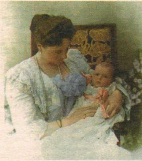
Царица Александра с дочерью

и терпение и любовь преодолевают все, и две жизни сливаются в одну, более благородную, сильную, полную, богатую, и эта жизнь будет продолжаться в мире и покое.