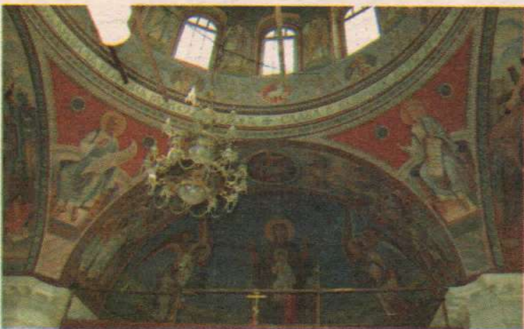
Роспись Ахтырского храма

Расскажите про главную святыню вашего храма — Ахтырскую икону Божией Матери, как она появилась на вашем приходе?