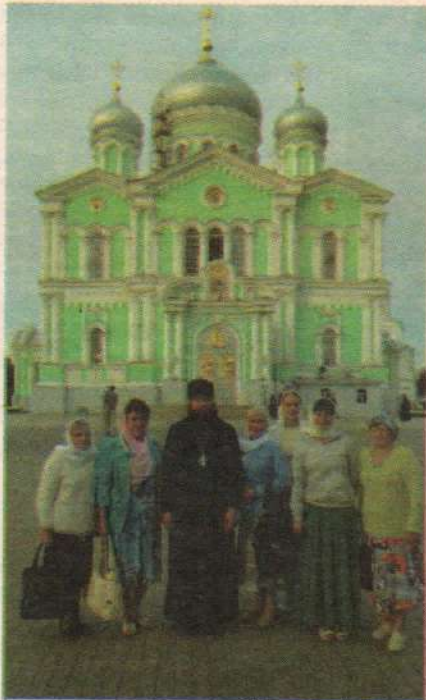
У Троицкого Собора

Во время посещения храмов обители к нам часто подходили монахини, послушницы и просили помочь убраться в храме — то пол помыть, то окна протереть... Сразу на ум приходила лукавая мысль: "Мы и так не успеваем всё посмотреть, автобус скоро уедёт, а тут ещё убираться". Но те из нас, кто всё-таки не смог отказать смиренной просьбе насельниц монастыря о помощи, не пожалели о проведённом времени. Отец Серафим при жизни говорил, что "нет паче послушания, как послушание церкви, если только тряпочкой протереть пол в доме Господнем, — превыше всякого другого дела поставится у Бога". Действительно, очень легко и радостно стало на душе после уборки в одном из храмов — как хорошо сознавать, что ты, немощный и грешный, можешь хоть как-то украсить Удел Самой Пресвятой Богородицы! И как ни странно, несмотря на то, что мы провели в храме около двух часов, мы