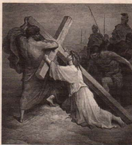
валось не много времени" (свт. Иннокентий Херсонский).

"Тело Иисуса немедленно было снято со Креста. И Господь снова вступил в мирный круг дружества и любви, из коего исторгла Его рука предателя. У Иосифа близ Голгофы был сад, в коем находились каменные скалы. В одной из них иссечена была пещера для погребения. Никто еще не был погребен в сей пещере, и Иосиф предназначал оную для себя и своего семейства (Ин. 19, 41). Посему пречистое тело Господа немедленно перенесено было в сад Иосифов. По обычаю, умастив тело Спасителя благовониями, обвили плещаницей и погребли, поелику до субботнего вечера оста-