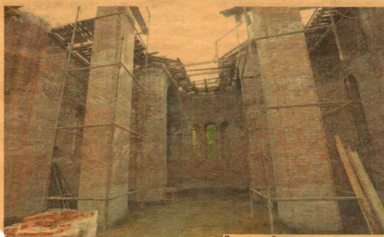
Внутренний вид строящегося храма

Как часто, спеша по делам, мы проходим мимо завода Электроизолит и с интересом поглядываем через дорогу на длинный зеленый забор. Он появился так неожиданно, словно огромный Ноев ковчег всплыл неизвестно откуда. А потом установили и высокий информационный щит, который как православная хоругвь развевается над городом с иконой преподобного Серафима Саровского и красивым видом будущего храма, и стало ясно — в нашем городе строится новая церковь.