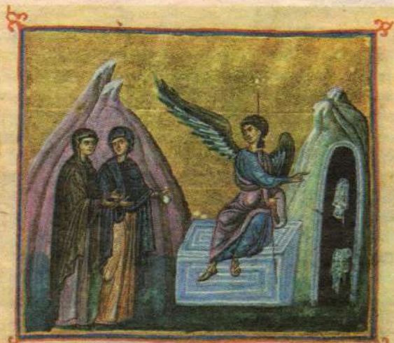
Явление ангела женам-мироносицам; Византия. XIII в.