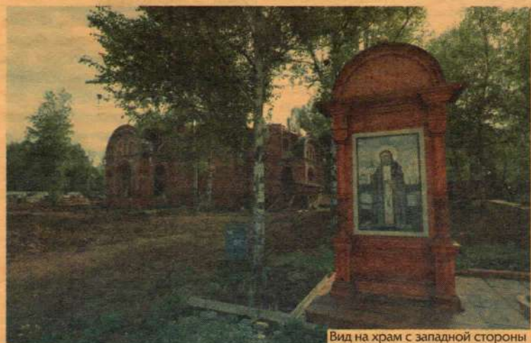
Вид на храм с западной стороны

Всем известны слова преподобного Серафима Саровского: "Смысл жизни человека в стяжании Духа Святого". Он всей своей жизнью явил нам пример достижения этой цели.