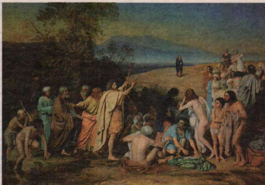
А. Иванов. Явление Христа народу. 1857 г.

В этот праздник в православных храмах совершается чин освящения воды. Церковь молится: «Сотвори ю (т. е. её — а. М.) нетления источник, освящения дар, грехов разрешение, недугов исцеление, демонов всегубительство, сопротивным силам неприступную, Ангельския крепости исполненную. Да вси почерпающии и причащающиися имеют ю ко очищению душ и телес, ко исцелению страстей, ко освящению домов и ко всякой пользе изрядную». Освящённая в этот двенадцатый праздник святая