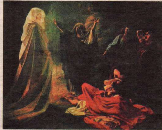
Н. Г. Саул у Аэндорской волшебницы. 1857 г.

Не случайно вскоре карты стали подвергаться запретам и преследованию в силу их явной связи с кощунством и нечи-