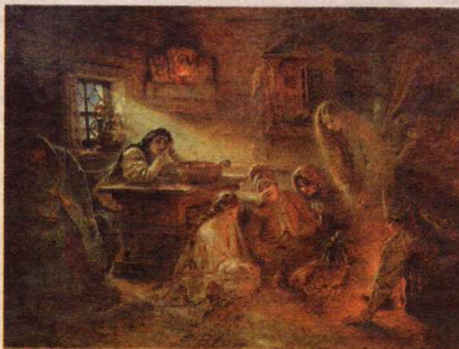
К. Маковский. Святочные гадания. 1890-е гг.

гина, пронзившее ребро Христово (Ин. 19:34), на что намекает и само название «лика», то есть копьё. «Черви» подразумевают евангельскую губку на трости: «один из воинов взял губку, наполнил уксусом и, наложив на трость, давал Ему пить» (Мф. 27:48). Другое толкование также связано со Страстями – это пронзённое сердце Христово. Наконец, «бубны» символизируют гвозди, которыми был распят Христос. Казалось бы, что общего у ромбовидных «бубнов» с гвоздями? Ответ понятен для тех, кто видел шляпки старых дореволюционных гвоздей: они квадратные, а не круглые, как современные. Такими были и средневековые гвозди. Иудейский след присутствует и в названии «kozyрь», что является искажённым словом «кошер», которым обозначается «чистая», ритуально приемлемая для иудеев пища.