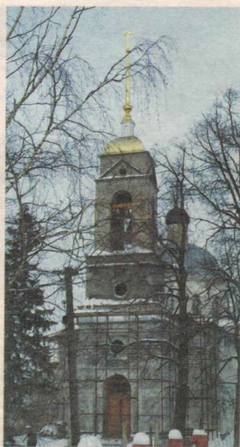
Васильевский храм (1836г.) Село Васильевское