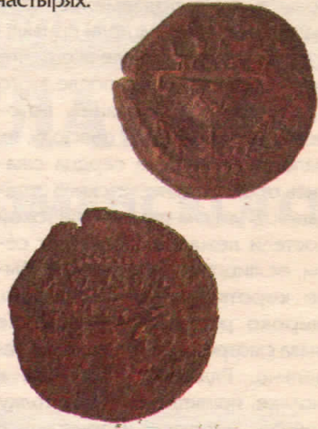
Монета времен Ирода I. Иудея. I век до н. э. Государственный Эрмитаж.