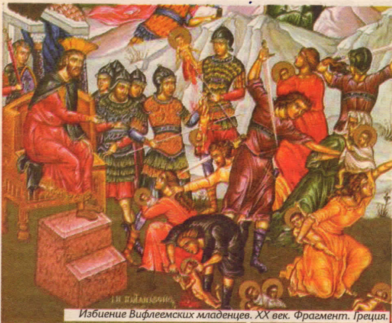
Избиение Вифлеемских младенцев. XX век. Фрагмент. Греция.

ма разгневался и послал избить всех младенцев в Вифлееме и во всех пределах его, от двух лет и ниже, по времени, которое выведет он от волхвов" (Мф. 2; 16), повествует нам евангелист Матфей. И жестокий приказ был исполнен.