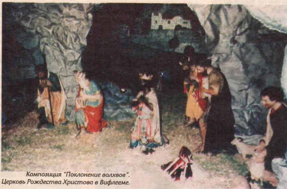
Композиция "Поклонение волхвов". Церковь Рождества Христова в Вифлееме.

Евангельские сведения очень скупы, но от первых веков христианства сохранилось немало преданий о царях-волхвах с востока, поклонившихся Новорожденному Царю Иудейскому. Так, в некоторых восточных преданиях говорится о завете, данном Адамом своему сыну Сифу. Он должен был взять из некоей пещеры дары, оставленные там Адамом и Евой, когда на небе появилась необычная звезда. Это завещание передавалось из поколения в поколение, пока не пришло время его исполнить. Древние мудрецы ежегодно поднимались на высокую гору, где в молитве в течение трех дней наблюдали за светилами, ожидая таинственную звезду. Со временем предания о волхвах с Востока перешли в традицию Западной Церкви, где установился и особый праздник "Трех