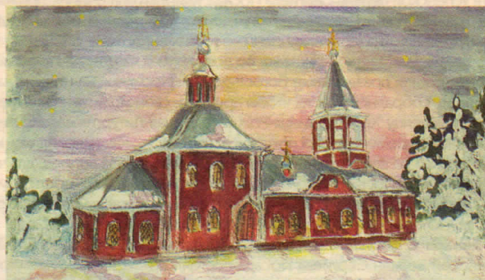
Ильинский храм. Попова Сима. 14 лет. СШ № 14

братья и сестры, сердечное поздравление с праздником Рождества Христова и наступившим Новым годом, который да будет для нас счастливым и благословенным.