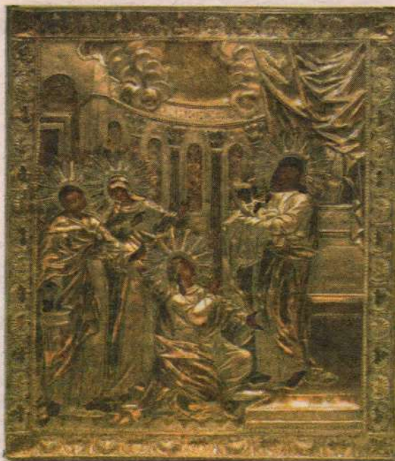
Икона Сретения Господня. XV в.

Спасение Твое, Бога, которое Ты уготовал всем людям на земле». Несмотря на все страдания, несмотря на все бесчисленные несправедливости этого мира, которые мы своими человеческими очами видя, своим человеческим умом прозреваем и сейчас