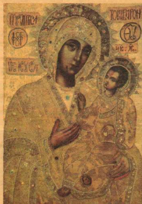
Иверская икона Божией Матери Село Закубежье.