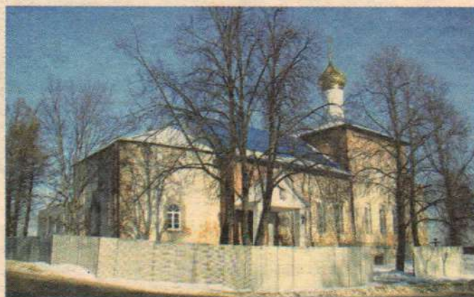
Сретенский храм в селе Константиново. Основан в 1690г., закрыт в 1931г., возрожден в 1999г.