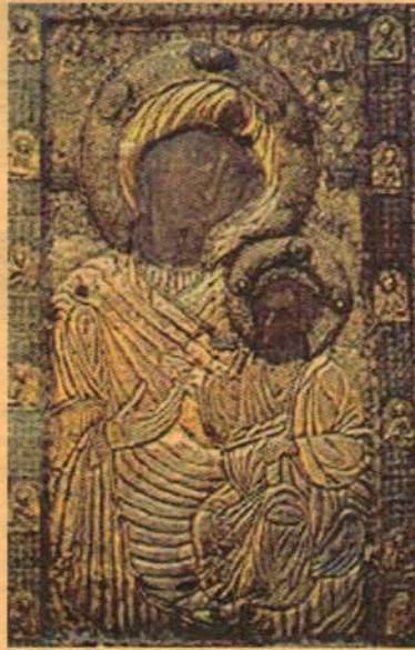
Иверская икона Божией Матери

Сама быть Хранительницей вашей не только в земной, но и в небесной жизни. Испросила Я у Господа милость вам, и доколе будете видеть икону Мою в своей обители, дотоле благодать Сына Моего к вам не оскудеет".