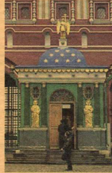
Иверская часовня на Красной площади в Москве. Закрыта в 1929г., снесена в 1934г., восстановлена в 1995г.

паствы нового списка с "общей нашей Заступницы Богоматери Вратарницы". При усердных молитвах братии Святой Горы в кратчайшие сроки таковой образ и был написан благочестивым священноиноком Лукой из афонского Ксенофонта монастыря.