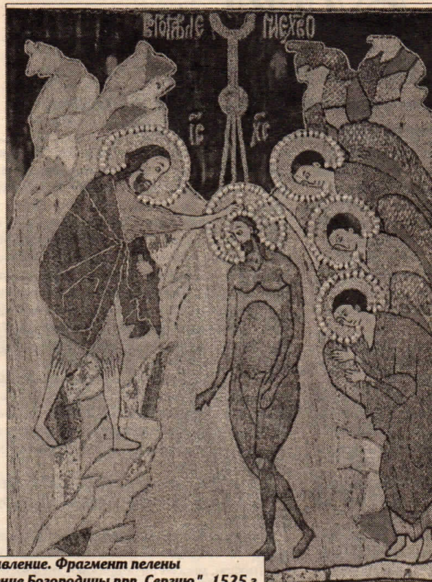
Богоявление. Фрагмент пелены “Явление Богородицы прп. Сергию”. 1525 г. Сергиево-Посадский музей-заповедник (СПГХМЗ)

подеви”, “Оглашеннии, главы ваша Господеви приклоните”; а также требовательный возглас диакона в конце первой части Таинства Причащения, Литургии оглашенных: “Елицы оглашеннии изыдите; оглашеннии изыдите... Да никто от оглашенных, елицы вернии...” (только верные. — Прим. ред.).