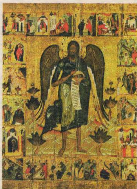
Икона середины XVI в. (около 1551 г.). Происходит из церкви Николы Надеина в Ярославле. Собрание Ярославского художественного музея.