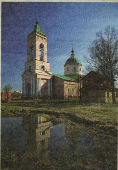
Богородицерождественский храм деревни Махра. Основан в 1826г., закрыт в 1941г., возрожден в 1990г.

24, суббота. Преподобного Силуана Афонского.