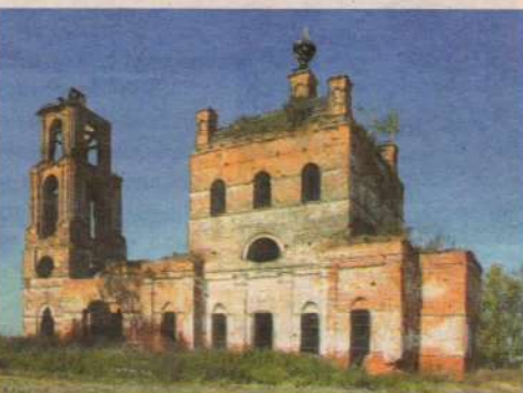
Церковь святых праведных богоотцев Иоакима и Анны. 1833. Село Акиманна Сергиево-Посадского района.

Это даже не просто крест. Это мученичество. Мученичество за Христа. А благодать Божия всегда укрепляла мучеников, укрепляла она и вас в вашей неравной борьбе за детей, укрепит она вас и теперь. Только бы не ослабела христианская убежденность и устремленность — вера наша. И теперь нам, подобно праведной Анне, надо просить у Господа чуда: "Господи! разреши болезнь сердца моего. Да благословится и прославится в рожденном мною Твое милосердие". И не усомнитесь, чудо совершится по вере вашей.