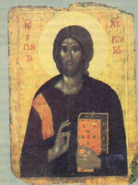
Спас Вседержитель. XIV век. Византия. Пронсходит из монастыря Пантократора на Афоне. Государственный Эрмитаж (ГЭ).

Среди всех книг на земле есть самая ценная. Может быть, она хранится и у тебя дома. Эту книгу особо почитают верующие, христиане, они стараются читать ее каждый день. В переводе с иностранного языка (греческого) ее название звучит так: "Благая весть".