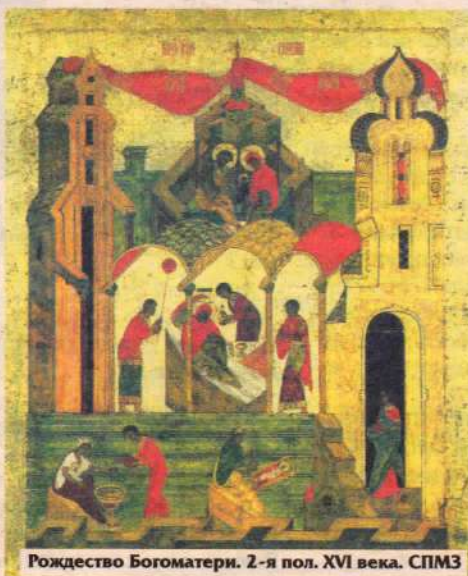
Рождество Богоматери. 2-я пол. XVI века. СПМЗ

В один из великих праздников старец Иоаким пришел в Иерусалимский храм с намерением принести жертву Господу, но приношение было отвергнуто священником. И больно ударили старца слова свя-