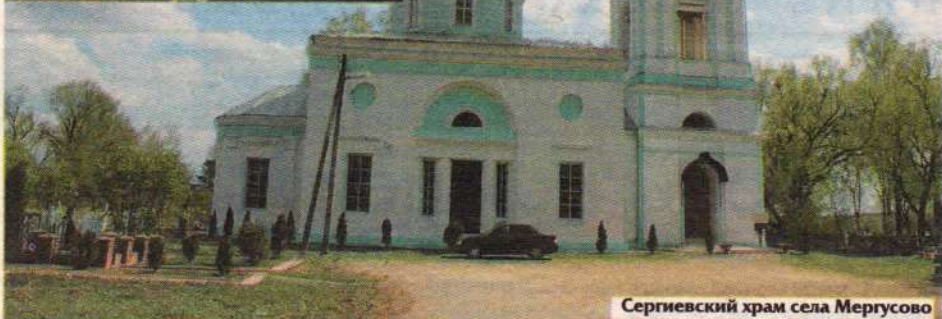
Сергиевский храм села Мергусово