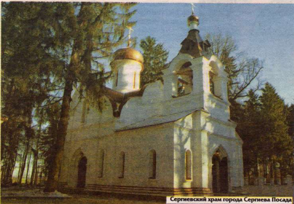
Сергиевский храм города Сергиева Посада