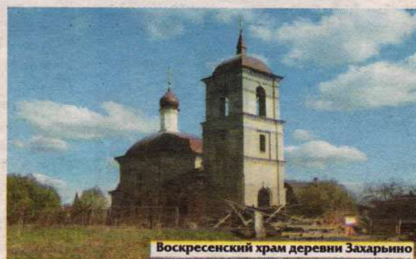
Воскресенский храм деревни Захарьино

Воскресенский храм деревни Захарьино построен в 1737 году с приделом преподобного Сергия Радонежского. В советское время, в конце 1950-х годов церковь была закрыта, а в 1970-е годы — разорена. В 1999 году в селе была образована православная община. В летнее время в храме совершаются богослужения.