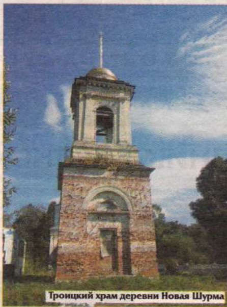
Троицкий храм деревни Новая Шурма

Троицкий храм деревни Новая Шурма — один из самых интересных памятников Сергиево-Посадского благочиния — в XIX веке в храме было освящено пять престолов, один из которых посвящён преподобному Сергию. Строительство храма было начато в 1798 году, закрыли храм в 1963 году в период хрущёвских гонений на Церковь. Летом 1994 года жители Новой Шурмы и окрестных деревень получили разрешение на восстановление церкви.