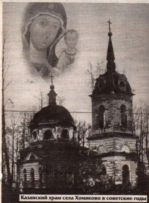
Казанский храм села Хомяково в советские годы

Вот одни из самых ярких. Однажды передо мной встала серьёзная проблема. Я не мог себе позволить уехать в отпуск, не организовав работы на колокольне, но, увы, не было ни денег на строительные леса, ни длинномера, чтобы привезти их с рынка. Оставался