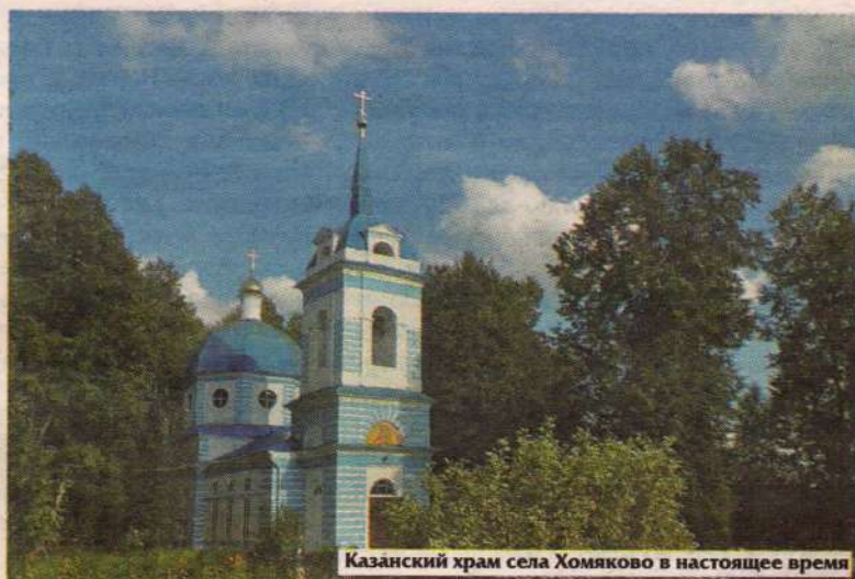
Казанский храм села Хомяково в настоящее время

Традиционное почитание на Руси Казанской иконы Богородицы имеет как общественное, так и личное измерение. Конечно, тот факт, что 4 ноября — день празднования в честь Казанской иконы Божией