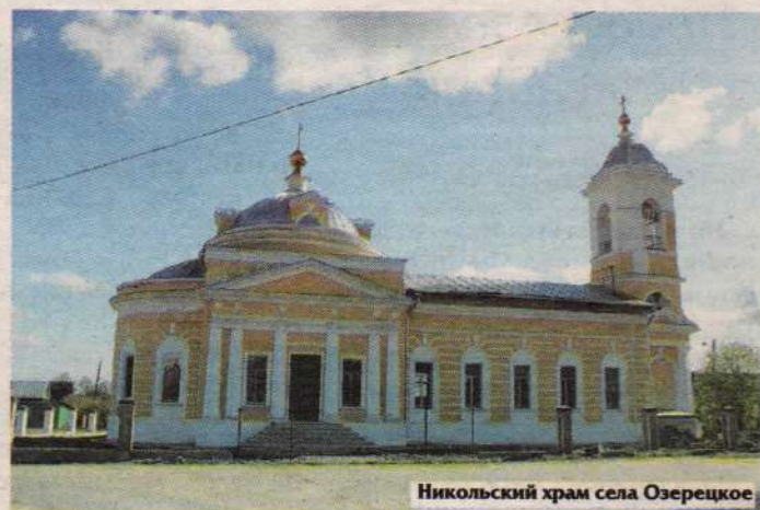
Никольский храм села Озерцево

Никольский храм села Озерцево. Храм с главным престолом во имя святителя Николая Чудотворца, приделами — в честь первоверховных апостолов Петра и Павла и преподобного Сергия Радонежского, был возведён в 1811 году. В 1937 году был закрыт. В 1994 году возвращён Русской Православной Церкви. Богослужения в храме совершаются регулярно по воскресным и праздничным дням.