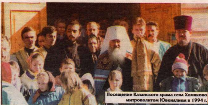
Посещение Казанского храма села Хомяково митрополитом Ювеналием в 1994 г.

Матери стал теперь государственным праздником — Днём народного единства, не может не вызывать радостного чувства. Во-первых, он отнес на задний план прежний день — 7 ноября, символизировавший скорее гражданское противостояние и братоубийство, нежели общее согласие. Во-вторых, надо понимать, что дело не в конкретных событиях Российской истории, давно ушедших в прошлое, а в их переосмыслении. Иначе говоря, от нас достаточно далеки времена взятия царём Иваном Грозным Казанского ханства, но важна многократно засвидетельствованная неиссякаемая сила заступничества Божией Матери, явленная в ответ на искреннее народное моление. И установление нового всероссийского праздника в память о событиях 1610-х годов вовсе не направлено, скажем, против поляков, но обращено к духовному и политическому опыту преодоления Смутного времени. Вообще смутные времена повторяются у нас с некоторой периодичностью, а сегодня и на мир в целом надвигается, судя по всему, большая смута. Народу нашему, привыкшему консолидироваться пред лицом тяжких испытаний, не выстоять без пробуждения духовной жизни, в которой первую роль играет молитва и приобщение к святыне. Но и в личном плане тот, кто с верой, благоговением и чистым помыслом приходит к Казанской иконе, получает отраду и вдохновение, исполняясь благодатной Господней силою.