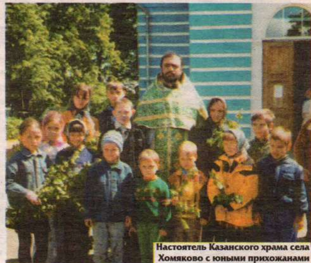
Настоятель Казанского храма села Хомьяково с юными прихожанами

Мои пожелания, прежде всего, обращены к молодым родителям. Хочется, чтобы они научились мудрости и любви при воспитании детей. Мало умиляться тому, как они повторяют за вами слова молитв, правильно крестятся и покорно открывают рот для вкушения Причастия. Слишком скоро они волюются во взрослую жизнь, которая сегодня не щадит ни отрочества, ни юности. И тут крайне важно с самого начала привить им такое понимание, чтобы в дальнейшем во всех трудных испытаниях вера в Господа Иисуса Христа и постижение Евангелия стали для них важнейшим принципом и путеводной звездой. А вообще хочу всех поздравить с замечательным праздником 4 ноября и пожелать благодатной помощи, здоровья и долголетия в молитве пред Казанской иконой Божией Матери.