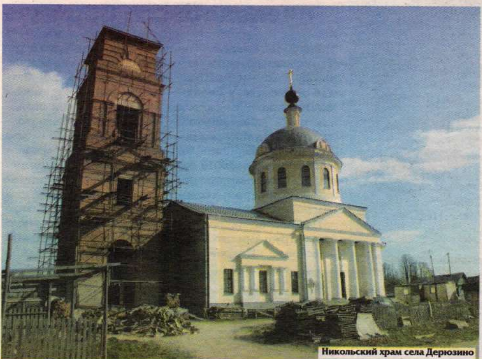
Никольский храм села Дерюзино