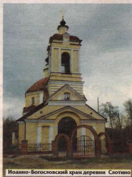
Иоанно-Богословский храм деревни Слотино

Иоанно-Богословский храм деревни Слотино возведён в 1822 году с одноимённым названием и с двумя приделами: южным — в честь Казанской иконы Божией Матери, северным — во имя преподобного Сергия Радонежского. Окончательно храм был закрыт в 1961 году. В 1992 году усердием местных жителей храм вновь был открыт. Богослужения в церкви совершаются регулярно по воскресным и праздничным дням.