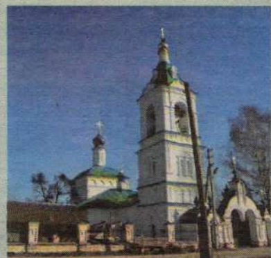
Казанский храм села Шеметово

Престольные праздники приходят Ильинского храма г. Сергиева Посада, Казанского храма села Хомьяково, Казанского храма села Шеметово, Казанского храма деревни Гагино, Иоанно-Богословского храма деревни Слотино, Сергиевского храма деревни Мергузово.