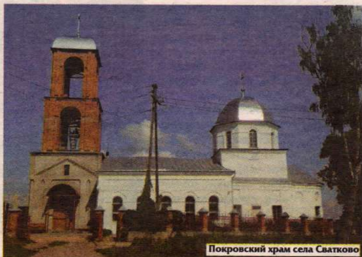
Покровский храм села Сватково

Иоанно-Богословский храм деревни Слотино возведён в 1822 году с одноимённым названием и с двумя приделами: южным — в честь Казанской иконы Божией Матери, северным — во имя преподобного Сергия Радонежского. Окончательно храм был закрыт в 1961 году. В 1992 году усердием местных жителей храм вновь был открыт. Богослужения в церкви совершаются регулярно по воскресным и праздничным дням.