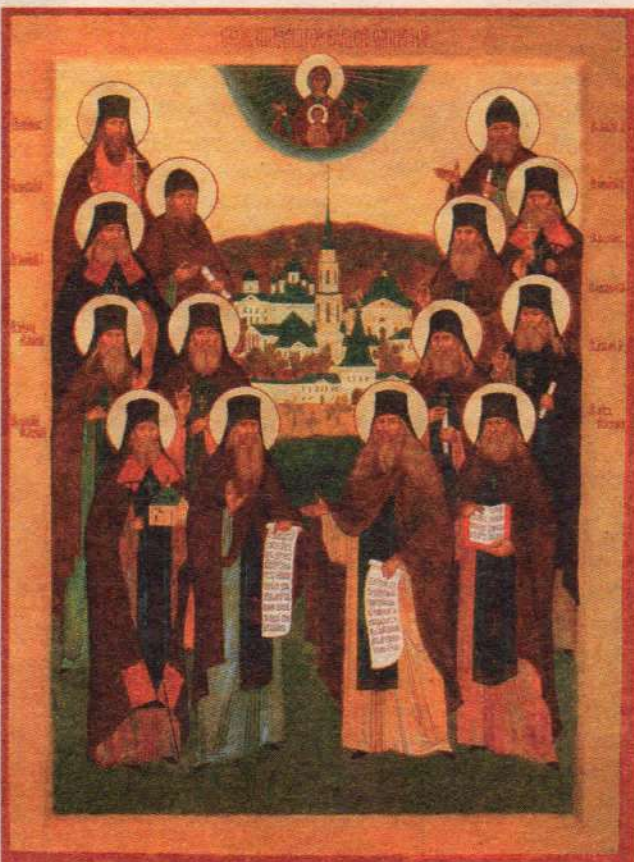
Собор Оптиных старцев. Икона XX века

не закрывались монастырскими стенами от боли и человеческих страданий. Они вместе с народом молитвенно несли и терпели его скорбь. Вместе с ним делили его радость. Они и сейчас молятся — "да утвердит Господь земное Отечество наше в православии и благочестии!" Старцы боролись и борются за человеческую душу. Душа человеческая может подняться до самых вершин познания Бога и может опуститься до мрачных подземелий ада. Может убелиться, как прекрасная невеста Христова, а