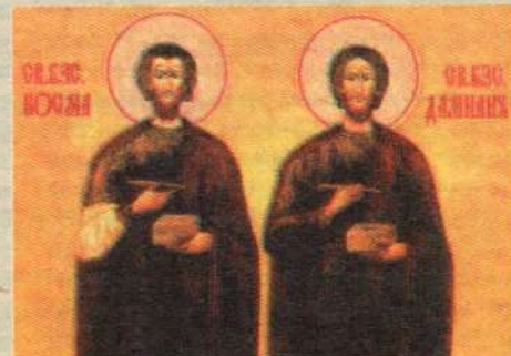
Святые бессребреники и чудотворцы Косма и Дамиан Асийские. XX в., холст, темпера.

14, воскресенье. Неделя 24-я по Пятидесятнице. Бессребреников и чудотворцев Космы и Дамиана Асийских.