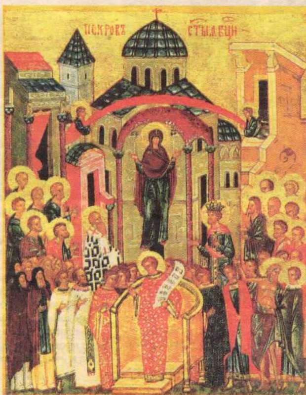
Покров Богоматери Новгородский Государственный историко-архитектурный и художественный музей-заповедник, начало XVI в.

По материалам официального сайта Московской Епархии