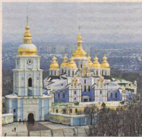
Михайловский монастырь в Киеве. Современный вид.

литы именовались Киевскими и всея Руси. После установления патриаршества Киевские митрополиты традиционно занимали первое место после патриархов.