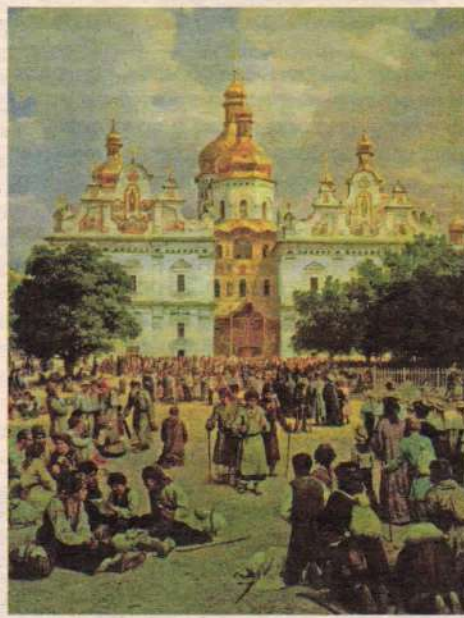
В.Верещагин. Великая церковь Киево-Печерской лавры. 1915 г.

До XIII века митрополиты жили постоянно в Киеве. Опустошение этого города заставило их перенести митрополичий престол сначала во Владимир на Клязьме, а в начале XIV века в Москву, откуда они управляли Русской Церковью до установления патриаршества (1589 г.). Сперва Русские митропо-