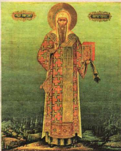
Михаил, митрополит Киевский

Вместе с великим князем Владимиром митрополит Михаил прибыл из Херсонеса (Корсуни) в Киев. Сначала святитель крестил княжеское семейство и бояр, а потом народ, собравшийся для этого на Днепре. Михаил ревностно проповедовал христианство, везде, где только мог, строил церкви, рукополагал священников и диаконов, ниспровергал идолов. Летописи повествуют, что часть народа, еще