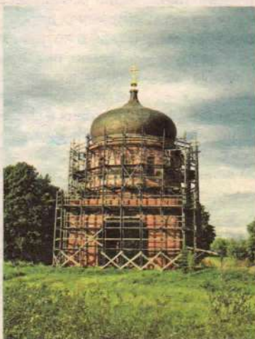
В 1998 г. в Гагине была образована православная община. В 2004 г. Большой театр России выделил крупную денежную сумму

За советское время от Казанского храма, разобранного на кирпич, осталась лишь ротонда.