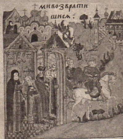
Приезд князя Дмитрия Ивановича в Троицкий монастырь. Миниатюра из Жития прп. Сергия. XVI в. Л. 243.

4 октября на сцене Дворца культуры имени Ю. Гагарина прошел спектакль «Сказание о прп. Сергии» в постановке областного драматического театра имени А. Островского.