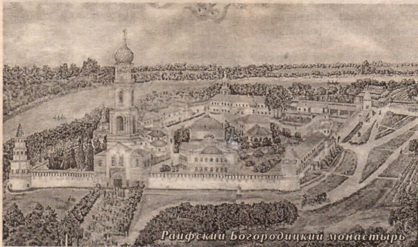
Райфский Богородицкий монастырь

Летом я ездила в Казань. Мы жили в просторном доме в пятидесяти километрах от города. У дома был красивый сад, большой огород и еще — висел гамак. Недалеко располагалось небольшое озеро. Здесь жила цапля и плавал уж. Когда он плывет, смешно высовывает голову из воды.