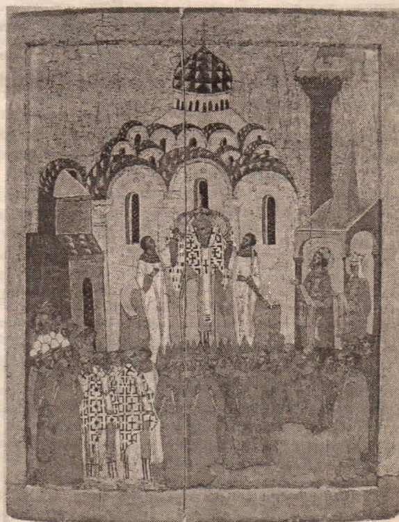
Воздвижение Креста. XVI в. Москва. СПГИХМЗ