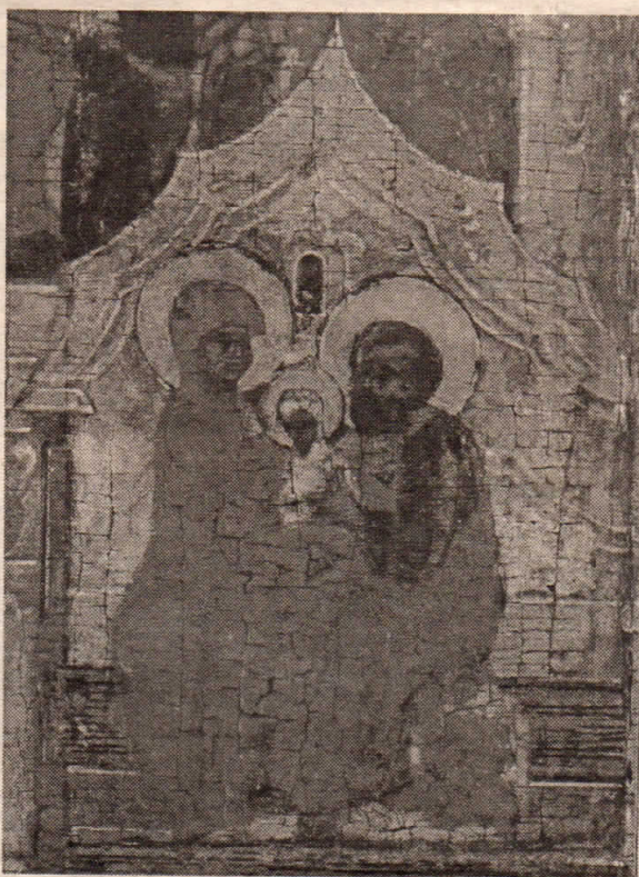
Рождество Богоматери. XVI в. Фрагмент. СПГИХМЗ

Второй праздник ныне — юбилей победы русского воинства над Мамаем. Сегодня на Куликовом поле особое торжество. Предстоятель Русской Православной Церкви, Святейший Патриарх