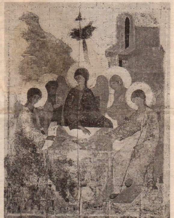
Троица Ветхозаветная. Гостеприимство Авраама и Сарры. Начало XV в. Москва. СПГХМЗ

В Ветхом Завете есть то, что Новый Завет отвергает, не принимает. Ветхий Завет пред-