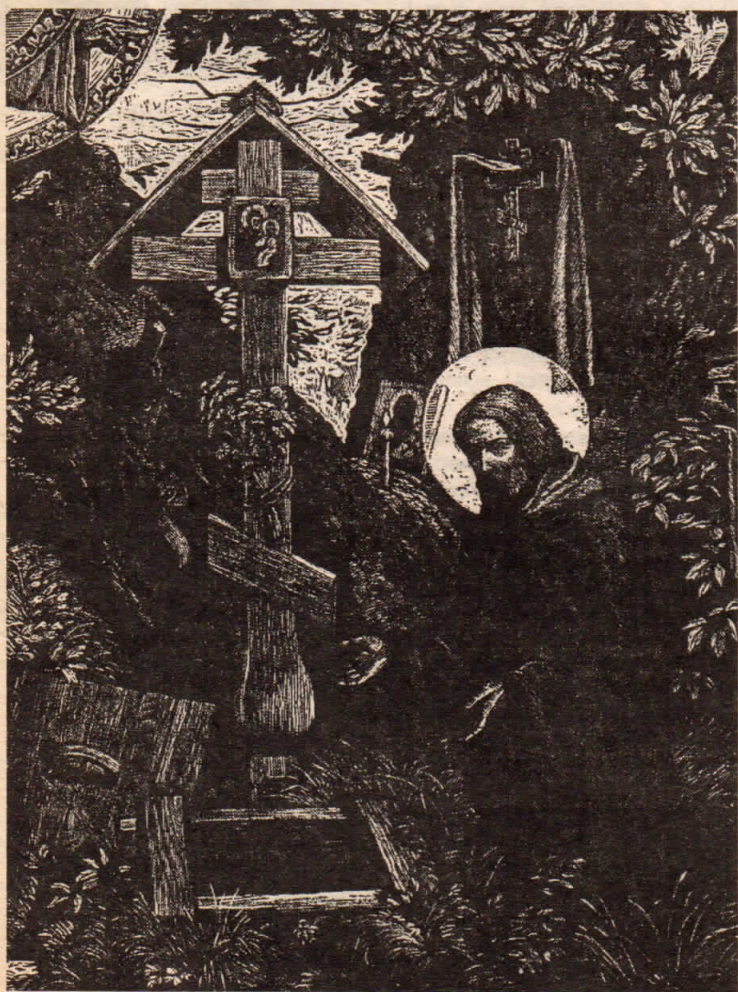
Преподобный Сергий Радонежский. У святого источника. С. М. Харламов