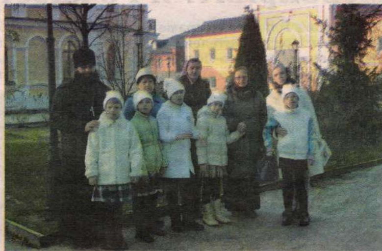
Паломничество воспитанников и наставников детского дома-интерната «Березка» в Спасо-Вифанский монастырь

Несомненно, проведенная декада милосердия оставила свой след в душах детей-воспитанников социальных учреждений. Но еще больший след эти дела милосердия оставили в тех детях и взрослых, которые посещали больных детишек, посеяв в их сердцах зерно сострадания и любви. ■