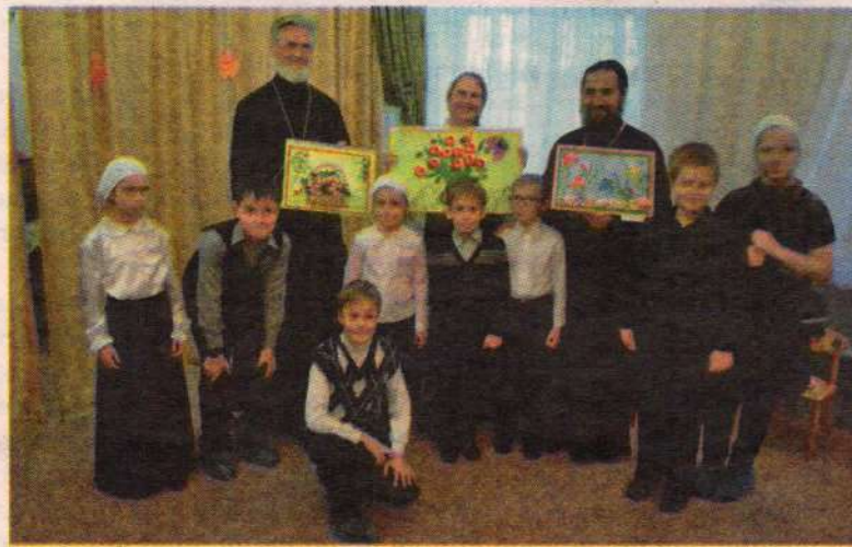
30 октября — учащиеся воскресной школы Успенского храма г. Сергиева Посада на встрече с воспитанниками Сергиево-Посадского реабилитационного центра «Оптимист»

годетными семьями прихода совершили паломническую поездку в две главные и величайшие святыни нашего района: Хотьковский Покровский женский монастырь и Троице-Сергиеву Лавру. Батюшка рассказал детям о преп. Сергии и его благочестивых родителях — преподобных Кирилле и Марии. 2 ноября дети из центра