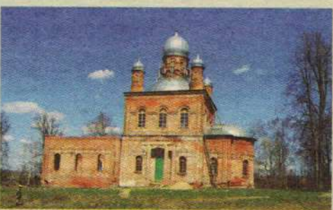
Михаило-Архангельский храм села Шарапово 1873-1937гг. Начало возрождения — 2000 год

27, воскресенье. Неделя 24-я по Пятидесятнице. Апостола Филиппа. Святителя Григория Паламы, архиепископа Фессалонитского. Заговенье на Рождественский (Филиппов) пост.