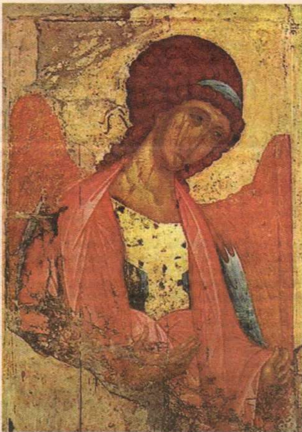
Архангел Михаил из деисусного чина Андрей Рублев, Государственная Третьяковская галерея, начало XV в., темпера

няющий меч будет всегда за нас, если только мы не вступим в союз с тем, с кем борется Архистратиг Михаил. Ангелы, оставшиеся верными своему Творцу и составившие воинство Архистратига Михаила, настолько утвердились в добре, что грех для них стал невозможным. Не потому, что они, имея свободную волю, не могут преступить воли Божией, а просто потому, что они не хотят этого делать, не хотят грешить. Обратите вни-