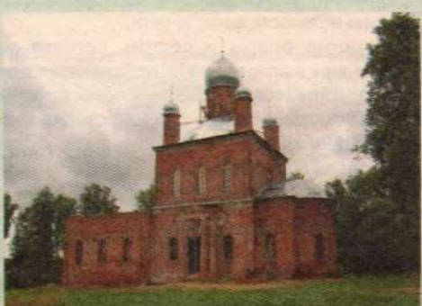
Михаило-Архангельский храм села Шарапова Сергиево-Посадского района

28, воскресенье. Неделя 27-я по Пятидесятнице. Прп. Паисия Величковского. Мучеников и исповедников Гурия,