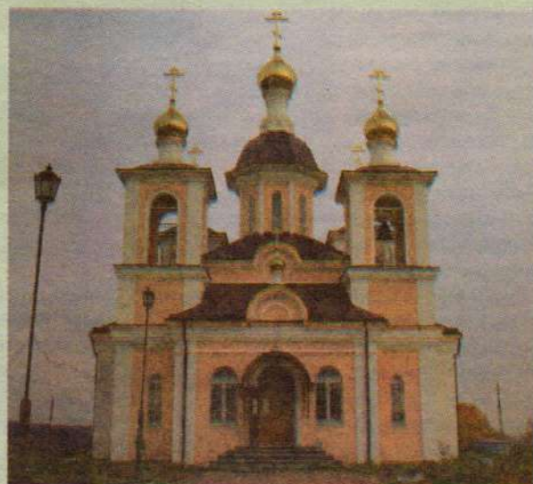
Лазаревский храм, с. Благовещенье

12, суббота. Лазарева суббота. Воскрешение прав. Лазаря. Прп. Иоанна Лествичника. (На трапезе разрешается вкушение рыбной икры). Престольный праздник прихода Лазаревского храма с. Благовещение (на новом городском кладбище).