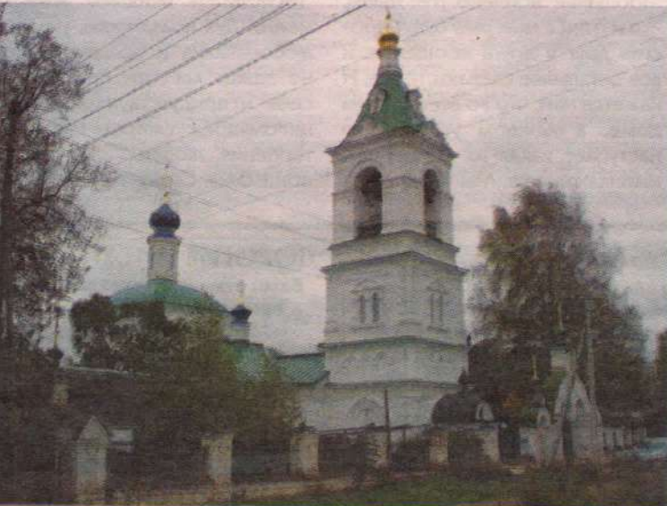
Казанский храм в Шеметове