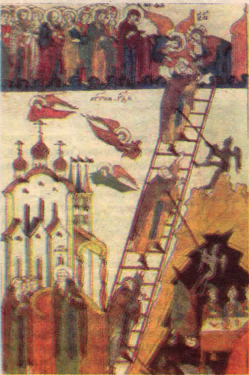
Видение прп. Иоанна Лествичника. Миниатюра. XVII в.

за сочинение такой книги, но принял за работу из послушания, по просьбе игумена Раифского монастыря. Название своего творения «Лествицей», он объяснял так: «Соорудил я лествицу восхождения... от земного во святая... во образ тридцати лет Господня совершенлетия, знаменательно соорудил лествицу из 30 ступеней, по которой, достигнув Господня возраста, окажемся праведными и безопасными от падения». Читающие «Лествицу» должны были ясно осознать, что путь к достижению совершенства весьма нелегок и требует упорного труда. Книга писалась для монахов, но любой взявший ее в руки может удостовериться, что советы, данные преподобным Иоанном, вполне приемлемы и для мирян. Опираясь на его мудрые советы как на надежный поручень, можно совершить трудное восхождение к Небу по лествице духовного совершенствования. Но, поставив ногу на первую ступень, нужно всегда помнить слова Спасителя, что «Царство Небесное силою берется, и употребляющие усилие восхищают его» (Мф. 11, 12).