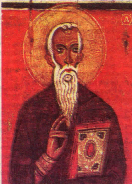
Прп. Иоанн Лествичник. XIII век. Новгород. ГРМ. Фрагмент иконы.

Преподобный Иоанн отличался скромным мнением о своих талантах и, наверное, сам не решился бы приняться