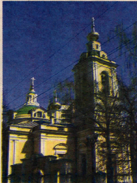
Храм свт. Николая в Кузнецках. Москва

В мире есть очень странная действительность, очень странная реальность. Она есть и вместе ее нет. Это — время. Вот не было этого мгновения жизни, а оно откуда-то пришло, и я говорю с вами. Но тут же и