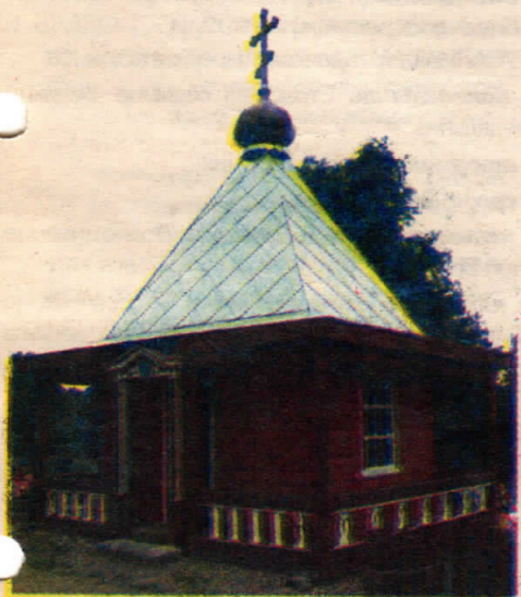
Кладбищенская часовня свт. Николая в Мухомове

Святая Церковь строго различает тех, кто умирает нераскаянным и без Причащения Христовых Тайн по собственной вине и упорству, и тех, кто не успевает перед своей кончиной сподобиться Тайн Покаяния и Евхаристии потому, что подвергается, по независящим от них причинам, внезапной или насильственной смерти. О самовольных или