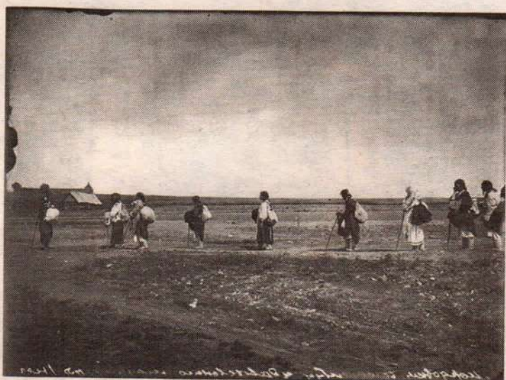
На пути в Лавру

В 2014 году, в год 700-летия Преподобного Сергия, когда ожидается, что Радонежскую