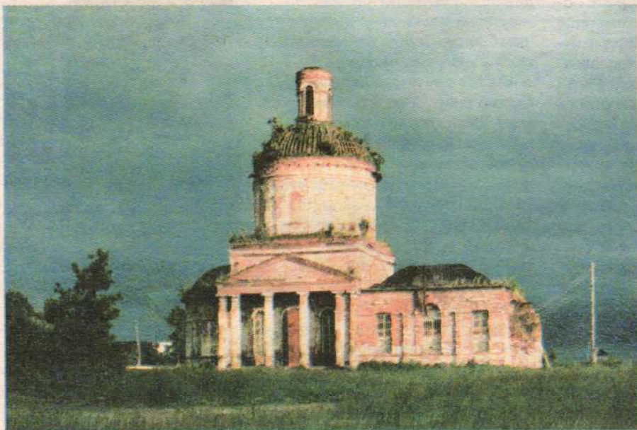
Начало 90-х годов 20 века

Ликийских в Бар, это вторая Пасха на нашем приходе! Местной традицией стала общая братская трапеза после богослужения, которая, впрочем, проходит у нас после каждой службы – так уж нам благословили.