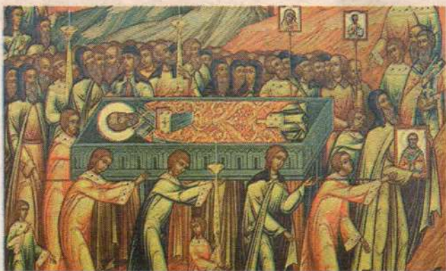
Перенесение мощей святителя Николая из Мир Ликийских в Бар

Мы называем святителя Николая правилом веры. Именно с этих слов начинается