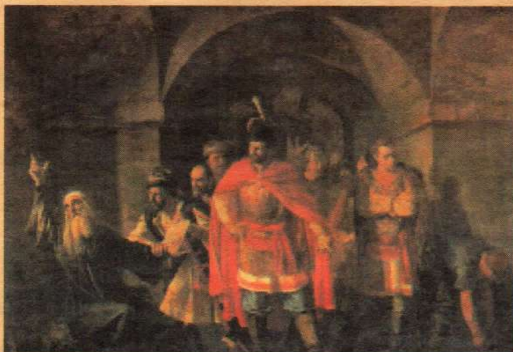
П. П. Чистяков. Патриарх Ермоген отказывает полякам, 1860г.

Вскоре праведный суд Божий свершился и над Тушинским воеводой: его постигла столь же печальная и бесславная участь, как и предшественника: он был убит собственными приближёнными