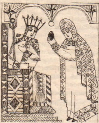
Рисунок Сергея Провады

В рассветной дымке таяла долина, Над облаками золотился Крест. Пришла к царю Мария Магдалина, Весть принесла: "Иисус Христос воскрес!" Нет, женщина, тебе я не поверю! Фантазии и вымыслу есть мера, Мысль оживила властное лицо. — Как не поверю я, что белое яйцо, тобою принесенное мне в дар, Вдруг станет красным, Вспыхнет, как пожар!