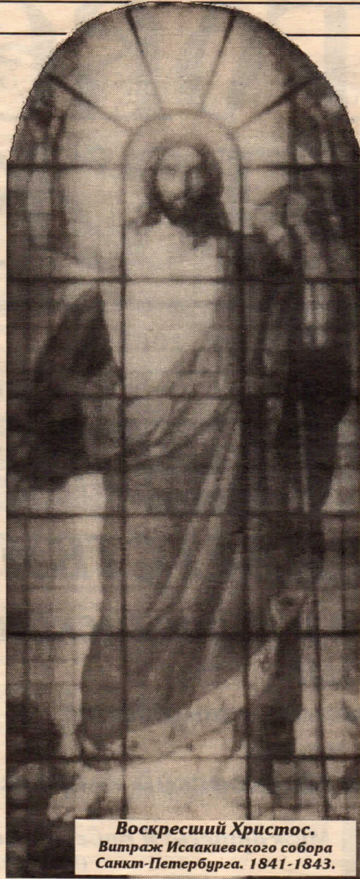
Воскресший Христос. Витраж Исаакиевского собора Санкт-Петербурга. 1841-1843.