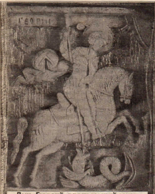
Вмч. Георгий, пронзающий змия. 2-я пол. XV в. Резьба по кости. Фрагмент запрестольного креста. СПГИХМЗ.

9 Мая — праздник Победы в Великой Отечественной войне — дорог каждому нашему соотечественнику. Мы вспоминаем победу не просто над врагом, но над мраком и ужасом, постигнувшим на наш мир.