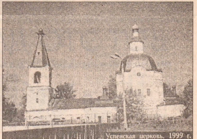
Успенская церковь. 1999 г.