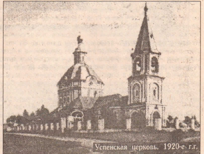
Успенская церковь. 1920-е г.г.