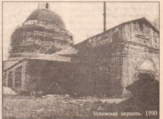
Успенская церковь. 1990