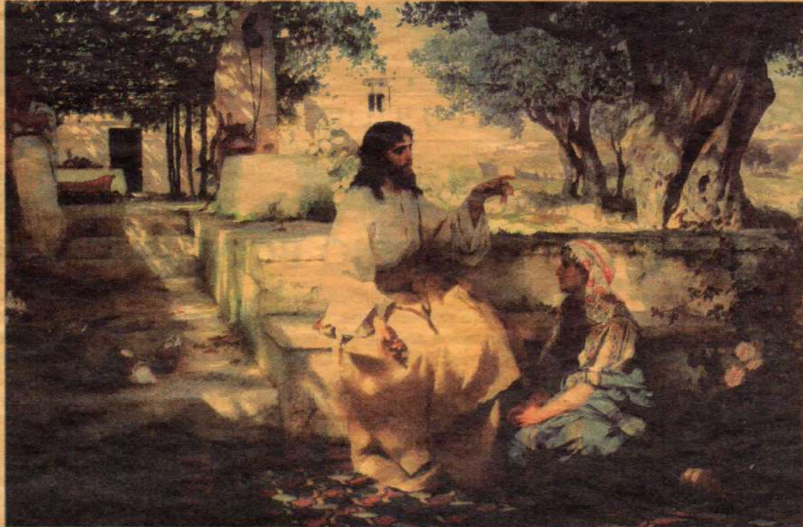
Генрих Семирадский: Христос у Марфы и Марии. 1886 год

хорами управляют, храмы расписывают. Продолжать можно долго. Таким образом на повестку дня выходит любопытная задача. Нужно сформулировать для христианского общества, что такое праведность в миру, каковы обязанности мирянина в повседневной жизни, без поры-