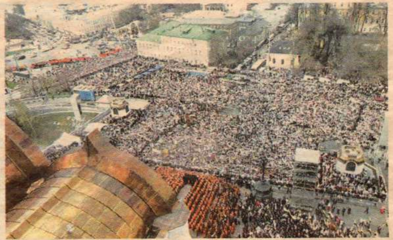
Стояние за веру у Храма Христа Спасителя 22 апреля 2012 г. На площади собралось около 65 тысяч человек

В наши дни ситуация изменилась — люди хотят веры, не требующей от них усилий — освятить яйца и яблоки, получить крещенскую воду, крестить ребенка, отпеть покойника, поставить свечку и повенчаться — вот джентльменский религиозный набор наших новых православных. Как только Церковь выходит за флажки и говорит о необходимости соблюдать заповеди, проходить оглашение перед крещением, она тут же получает возмущённую реакцию со стороны обывателя, который просит, чтобы его оставили в покое.