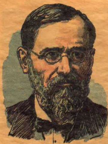
Историк Василий Осипович Ключевский

Жизнеописатель, сам живший в братстве, воспитанном Сергием (имеется ввиду преподобный Епифаний Премудрый, составитель жития преподобного Сергия Радонежского – ред.), живыми чертами описывает, как оно воспитывалось, с какой постепенностью и любовью к человеку, с каким терпением и знанием души человеческой. Мы все читали и перечитывали эти страницы древнего жития, повествующие о том, как Сергий, начав править собиравшейся к нему братией, был для неё поваром, пекарем, мельником, дровоколом, портным, плотником, каким угодно трудником служил ей, как раб купленный, по выражению жития, ни на один час не складывал рук для отдыха, как потом, став настоятелем обители и продолжая ту же чёрную хозяйственную работу, он принимал искавших у него пострижения, не спускал глаз с каждого новика, возводя его со степени на степень иноческого искусства, указывал дело всякому по силам, ночью дозором ходил мимо келий, легким стуком в дверь или окно напоминал празднословившим, что у монаха есть лучшие способы проводить досужее время, а поутру осторожными намёками, не обличая прямо, не заставляя краснеть, «тихой и кроткой речью» вызывал в них раскаяние без досады.