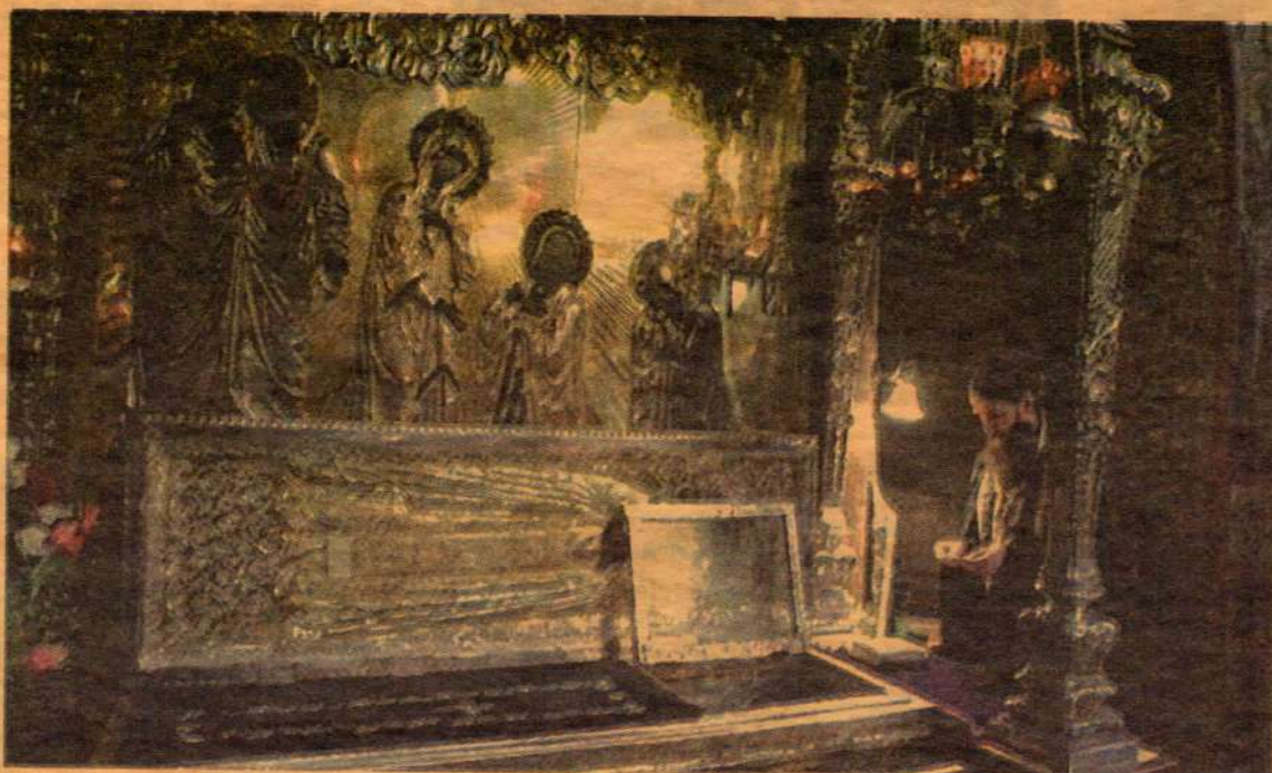
Рака с мощами преподобного Сергия Радонежского в Троицком соборе Свято-Троицкой Сергиевой Лавры