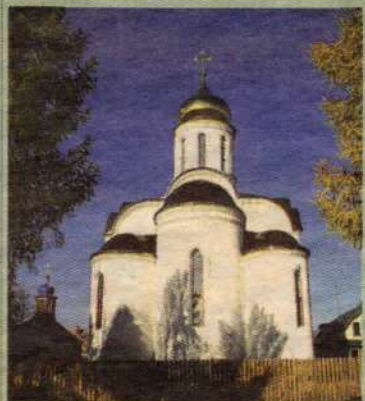
Храм Всех святых в земле Русской просиявших города Краснозаводска

22, воскресенье. Неделя 2-я по Пятидесятнице. Всех святых в земле Русской просиявших.