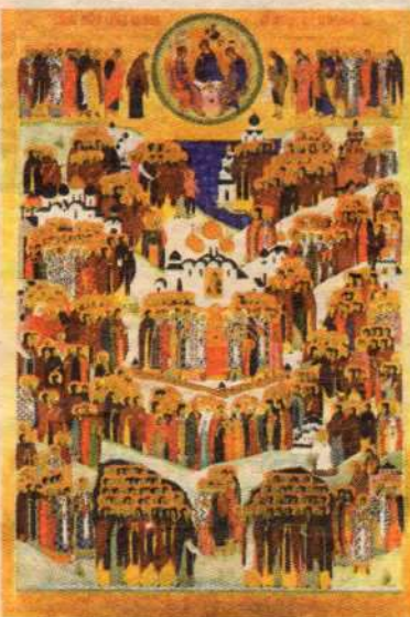
Икона Всех святых в земле Русской просиявших

практики какого-нибудь особенного самоистязания, нет так называемой аскезы, есть тихий труд и пост, пост и труд. Так живут наши монастыри.