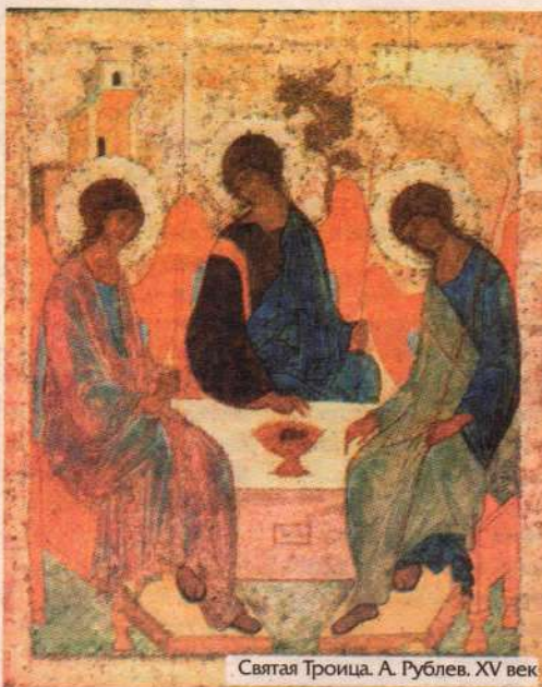
Святая Троица. А. Рублев. XV век