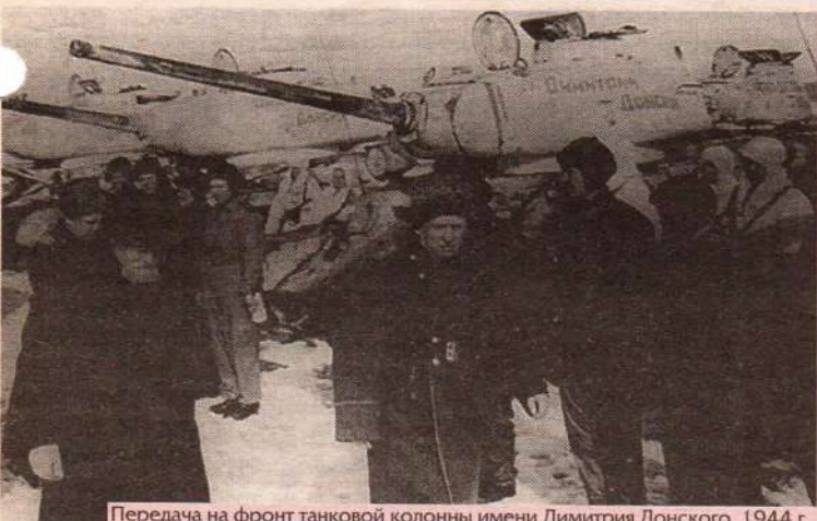
Передача на фронт танковой колонны имени Димитрия Донского. 1944 г.