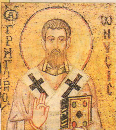
Свт. Григорий Нисский