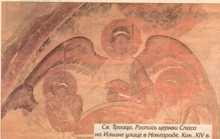
Св. Троица. Роспись церкви Спаса на Ильине улице в Новгороде. Кон. XIV в.

(к вопросу о развитии иконографии и гимнографии Святой Троицы)