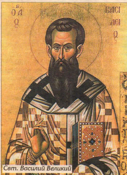
Свт. Василий Великий

Объяснить и точно выразить православное исповедание веры в Единосущного и триипостасного Бога удалось великим Каппадокийцам, трем