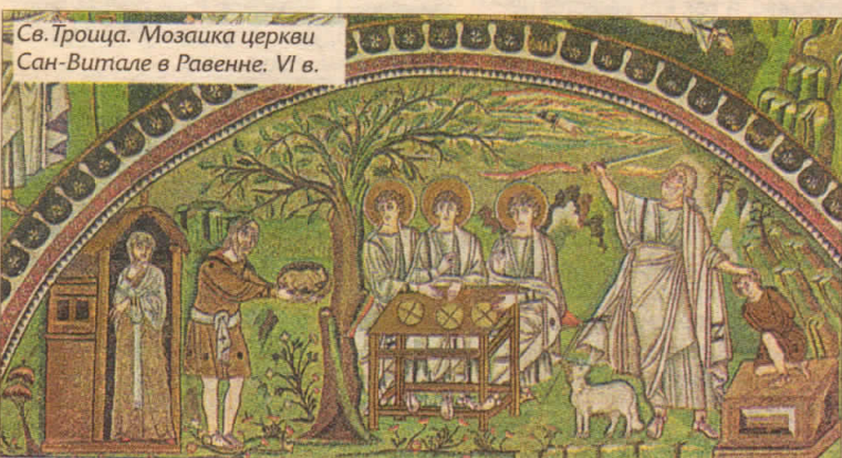
Св. Троица. Мозаика церкви Сан-Витале в Равенне. VI в.

Что весь этот «литургический сдвиг» связан с именами прп. Сергия и его учеников, принципиально не подлежит сомнению, но как и в какой степени, может показать только тщательное историческое исследование. Говоря об иконе праздника, например, нужно помнить, что во времена прп. Сергия и Андрея Радонежских праздничной иконой Недели Пятидесятницы несомненно был образ «Сошествия Святого Духа на апостолов», который обычно назывался просто Пятидесятница. Да можно ли вообще объяснить возникновение праздника Троицы одним только русским литургическим творчеством, игнорируя его очевидные византийские корни, или еще проще, «чествованием Троицы Рублева», вскоре после ее написания?