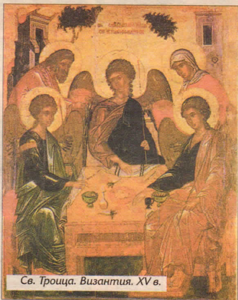
Св. Троица. Византия. XV в.

В Великом каноне прп. Андрея (в среду первой седмицы Великого поста)