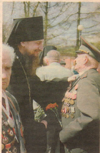
Встреча с ветеранами 9 мая 2006 г.

Материалы подготовил прот. Андрей Крашенинников