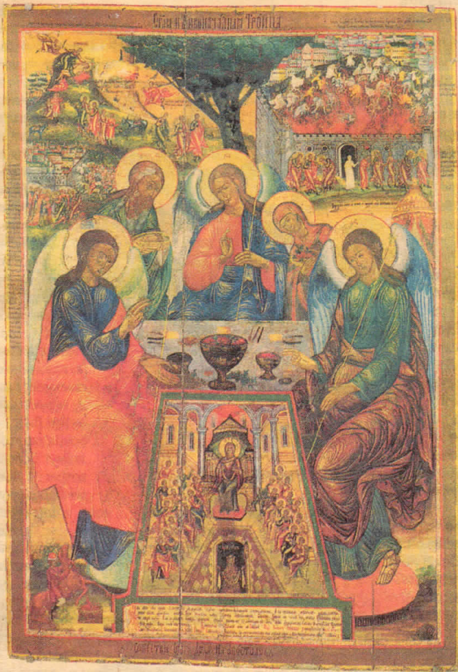
Троица Ветхозаветная, с Сошествием Св. Духа на апостолов. Кон. XVII века (под записью XIX века). СПГИХМЗ.

Жизнь по правде Христовой ведет к разумению, и тот, кто касается небесных тайн, знает, как надо бережно и терпеливо относиться к тем, кто их еще не понял, чтобы хранить в себе это сокровище благих как залог, что откроется и другим донные ими непонятое. И это наш переход Духом Святым от человечества Христа к Его Божеству. Духом Святым открывается, что человек, идущий путем заповедей, идет путем Бога. Содрогнемся же, братья, — говорит блаженный Феодорит Болгарский, — помыслив, что у кого нечиста жизнь, для того бесполезна и вера.