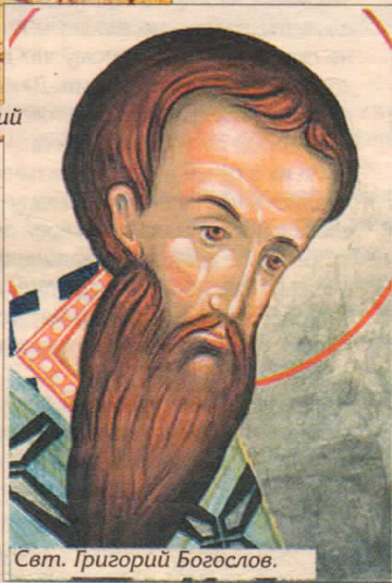
Свт. Григорий Богослов.