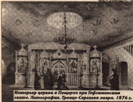
Интерьер церкви в Пещерах при Гефсиманском ските. Литография. Троице-Сергиева лавра. 1876 г.

П ОСЛЕДНИЙ в первом учебном году урок основ православной культуры в 29-й школе было запланировано провести в Малинниках, на Гремячем ключе. Но человек предполагает, а Бог располагает. Не доехали до источника каких-то 3 км: «Поворачиваем назад, дорожку совсем размыло, не прорвемся!» Юных подвижников нашлось в двух «газелях» видимо-невидимо: «Да мы пешком дойдем!» Педагоги оказались неумолимы: «Нет, под дождем и по грязи гулять не станем, едем в скит». Вот так на деле ученики и проверяли выдержку, мужество, терпение и выносливость, которым, наряду с другими добродетелями, обучались целых восемь месяцев. Обратная дорога оказалась более долгой и тяжелой. Самые предусмотрительные делились скудными съестными запасами с младшей «братией», не столь крепкой духом.