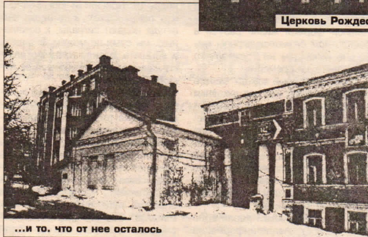
Церковь Рождества Христова в начале XX века...

церковь просуществовала до конца 1729 года. В ноябре того же года архимандриту Варлааму «бьют челом... попы и приходские люди» с просьбой вместо обветшавшей деревянной построить одноименную каменную церковь с приделом на том же месте. Вскоре после прошения по указу императора и по приказу Синода было начато строительство каменной церкви «при пособии монастыря», законченное в 1736 году. Храм во имя Рождества Пресвятой Богородицы был освящен архимандритом Варлаамом (17 декабря 1736 года).