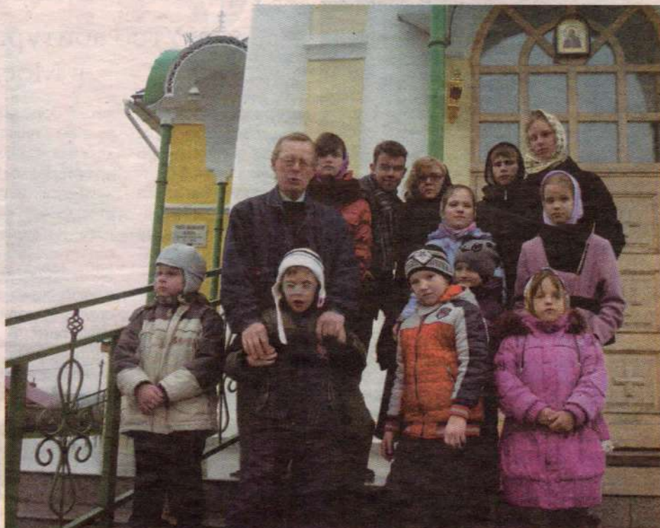
Папа, мама и я — вместе дружная семья