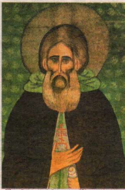
Шитый покров 1-й четверти XV века — одно из наиболее ранних изображений святого

никогда больше не отступал от веры, чтобы память о святом Сергии Радонежском помогала и нам, людям XXI века, преодолевать трудности и соблазны