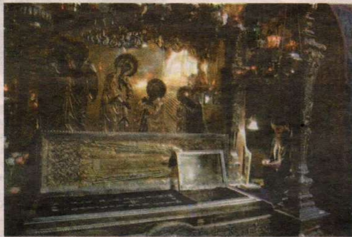
Рака с мощами преподобного Сергия Радонежского

Чтение заканчивается, и монахи начинают петь тропари. Поют споро, ритмично, без всякой заунывности и печали. Чувствуется, что им сейчас — хорошо и радостно, хотя и поют они о покаянии. И это состояние невольно передаётся и другим.