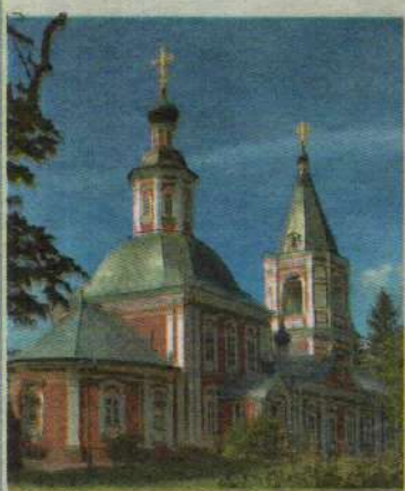
Ильинский храм, г. Сергиев Посад

21, понедельник. Седмица 7-я по Пятидесятнице. Явление иконы Пресвятой Богородицы во граде Казани.