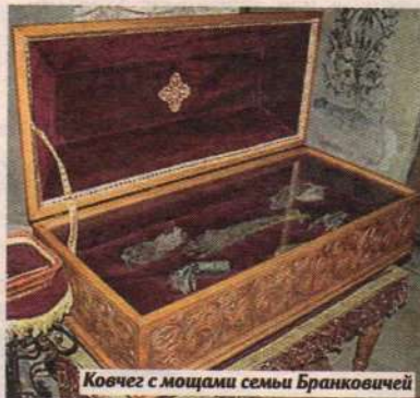
Ковчег с мощами семьи Бранковичей

Приняв монашеский постриг без изменения имени, она последние годы своей жизни провела в Сре-