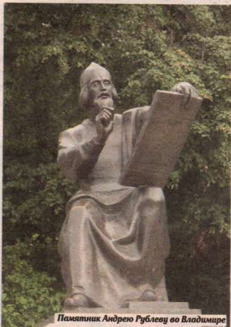
Памятник Андрею Рублеву во Владимире

Преподобный Никон еще в молодые годы решил принять монашеский постриг и пришел в обитель преподобного Сергия Радонежского, но тот его не принял, а отослал к своему ученику Афанасию Высоцкому в Серпухов. Наверное, именно там Никон превратился в одного из образованнейших людей своего времени, научился любить и понимать искусство, прекрасным знатоком и ценителем которого был его суровый учитель.