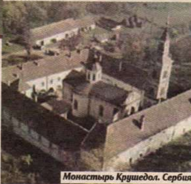
Монастырь Крушедол, Сербия

Почитание памяти святой Ангелины в Русской Православной Церкви началось в XVII веке и бывает дважды в году (14 июля и 10 (23) декабря).