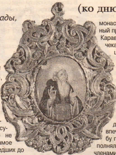
Прп. Сергей Радонежский. Панагия. Сер. XVIII в. Троице-Сергиева Лавра. СПГИХМЗ

По преданию, первая икона с образом святого была написана его племянником свт. Феодором Ростовским. Если она и существовала, то не сохранилась. Самое древнее из дошедших до нас изображений прп. Сергия передает надгробный покров (он полагался на гроб) — памятник лицевого шитья, датируемый 20-ми годами XV столетия (ныне экспонат СПГИХМЗ). Дубовый гроб прп. Сергия в настоящее время находится в Успенском соборе Лавры, у правого клироса, под стеклом. Отдельно он был установлен в кон.