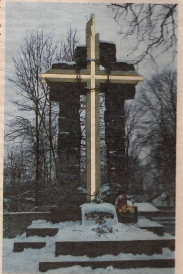
Памятный знак пострадавшим за веру во Христа в годы гонений и репрессий. Установлен 5 декабря 2012 года на Вифанской улице в Сергиевом Посаде