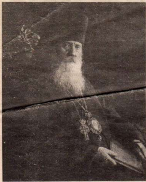
Преподобномученик Кронид (Любимов)

Предлагаем нашим читателям одну из бесед архимандрита Крониды (Любимова), посвященную святителю Николаю, архиепископу Мир Ликийских, чудотворцу.