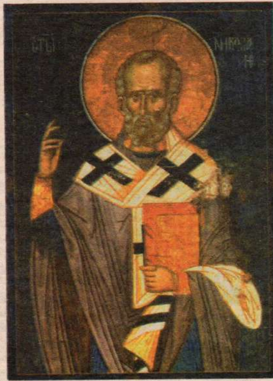
Фреска в храме Вознесения Господня, XIV век. Монастырь Високи Дечани. Сербия. Косово и Метохия.

в слова Спасителя, в их истину, но всю жизнь только оскорблявший Его, делавший только угодное своим страстям, — таковой