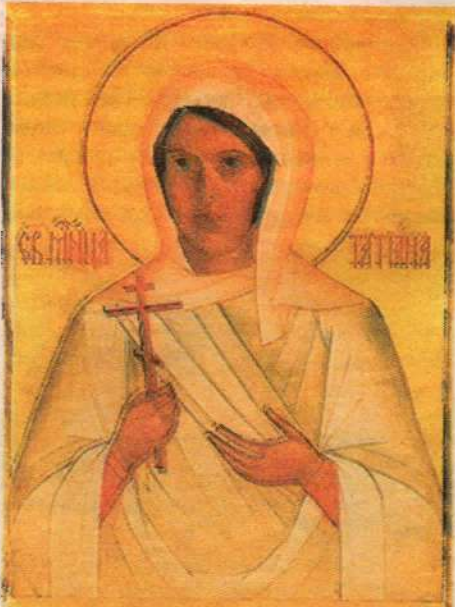
Икона святой новомученицы Радонежской Татианы Гримблит

Мы поднялись с ступенек часовни и пошли служить ночную панихиду.