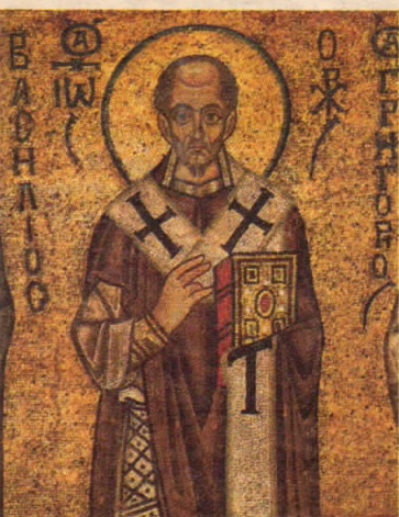
Свт. Иоанн Златоуст. Мозаика Софийского собора в Киеве. XI век.