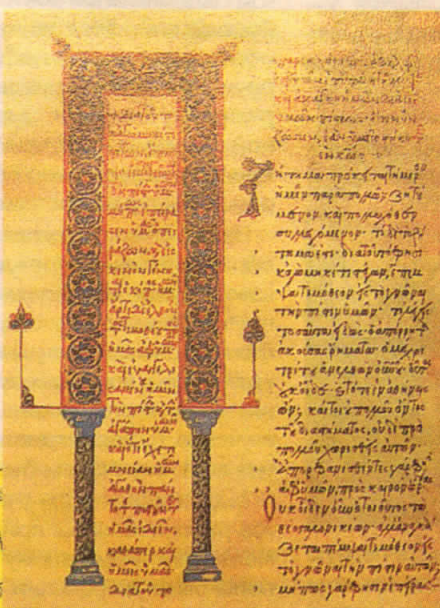
Творения свт. Иоанна Златоуста. Рукопись XIV века на греческом языке.

потребовал созыва собора для официального восстановления его на архиепископской кафедре. Но энтузиазм толпы был настолько велик, народ так просил его поскорее вернуться назад, что формальностями решено было пренебречь. Немедленно по возвращении Златоуст прочитал в соборе св. Софии очередную обличительную проповедь. Для описания