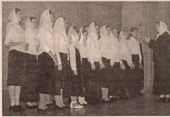
Хор воскресной школы

В этот же день целый ряд мероприятий прошел в гимназии № 5. Их открыл игумен Иоанн (Самойлов). После приветственного слова благочинного вниманию слушателей были представлены небольшие доклады о духовно-нравственном и патриотическом воспитании подрастающего поколения.