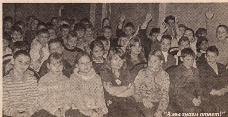
«А мы знаем ответ!»