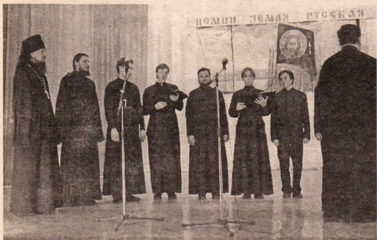
Выступает хор учащихся Московских Духовных школ

Преподобный Сергей Радонежский, небесный покровитель Русской земли, в годину междоусобной розни призывал наш народ к миролюбию и единомыслию. Времена изменились, но, как и шестьсот лет назад, перед нами снова встает вопрос: что сегодня всех нас, таких разных и неповторимых, сплачивает и объединяет? Мы одна большая семья. У нас по-прежнему общая страна, общий язык, общая история и культура, общие ценности, общие памятные даты и праздники, общие надежды, общее дело, общая дорога в будущее. Ярким подтверждением стремления современной России сохранить свою самобытность и лучшие черты своего национального характера являются все более возрастающий интерес к истокам родной культуры, своим историческим корням и проведение многочисленных форумов, направленных на развитие партнерских отношений.