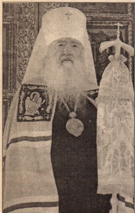
Возлюбленные служители алтаря Господня, всечестные иноки и инокини, дорогие братья и сестры!

С нами Бог, разумеете, языцы, и покарайтесь: яко с нами Бог