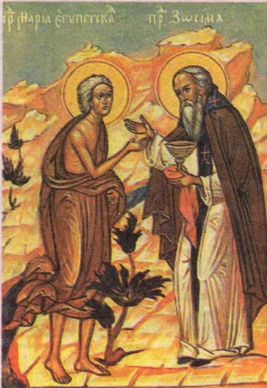
Прп. Мария и старец Зосима Икона. Нач. XX века.

даже зимой умудряются ходить с обнаженными пупками. И как не смотреть, как от этого всего удержаться, когда все кругом пропитано этим духом? А мы, наоборот, вопреки всему день и ночь должны подвизаться за внутреннюю чистоту и целомудрие.