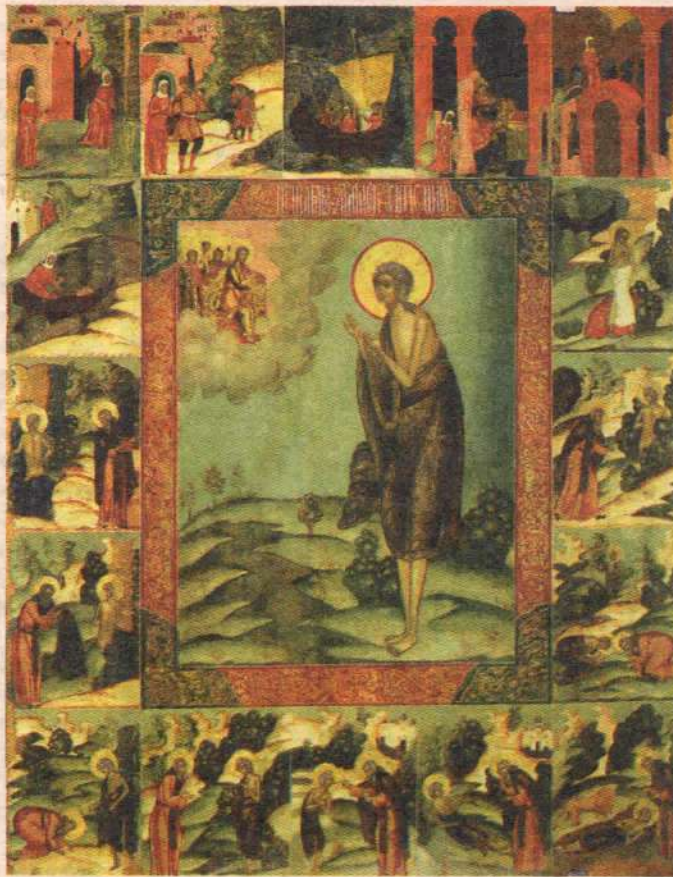
Святая Мария Египетская с житием. Икона. XIX век.

Сейчас надеюсь на милость Божию, что в Великий пост многие из нас на телевизор положили чехол. Не все это выдерживают. Потом пройдет пост, наступят дни Святой Пасхи, и опять — новости, передачи, фильмы, сериалы. И сами вы знаете, что и молодые и старые сидят перед телевизором одну минуту, другую, смотрят одну сцену, другую.