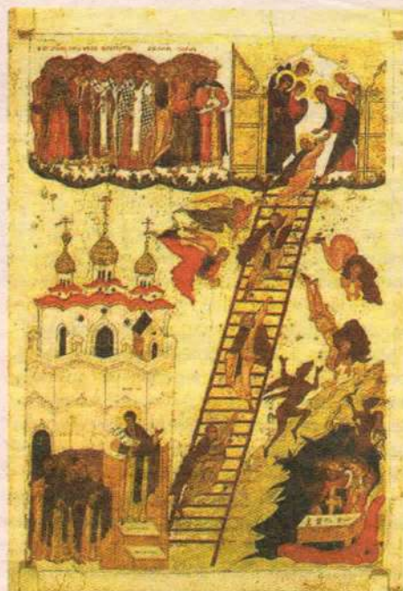
Лестница. Икона нач. XX века.

но все они были красивы, все нарядно одеты, и так называемая "сильная половина" коллектива их в этот день поздравляла. Независимо от степени своей воцерковленности они, кроме батюшки, видели во мне представителя мужского пола; и как бы