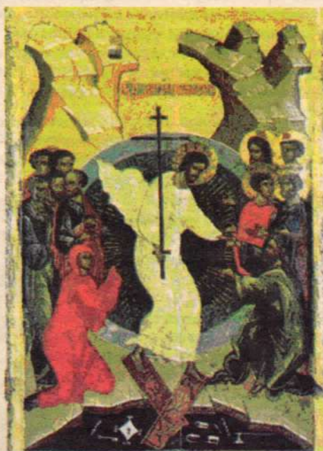
"Воскресение-Сшествие во ад". XV в. Новгород.

Но не отвергает и тех, кто, преодолев в своей душе сомнения, приблизился к Богу только в зрелом и даже преклонном возрасте. "Да не устращатся они своего замедления, Господь с любовью приемлет последнего, так же, как и первого, — и дела приемлет, и намерения целует".